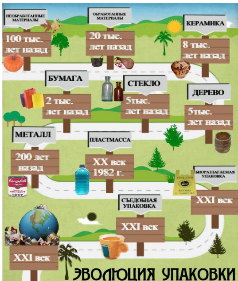
Рисунок 1. Эволюция упаковки

определенных навыков. Существуют определенные понятия, такие как форма, пространство, композиция, цвет и др., которые дизайнер должен знать и уметь правильно с ними работать.