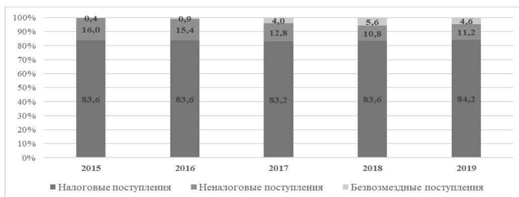
Рисунок 1 – Структура доходов консолидированного бюджета за 2015–2019 гг., в млн руб.

Структура доходов консолидированного бюджета Республики Беларусь за 2015–2019 гг. представлена на рисунке 1.