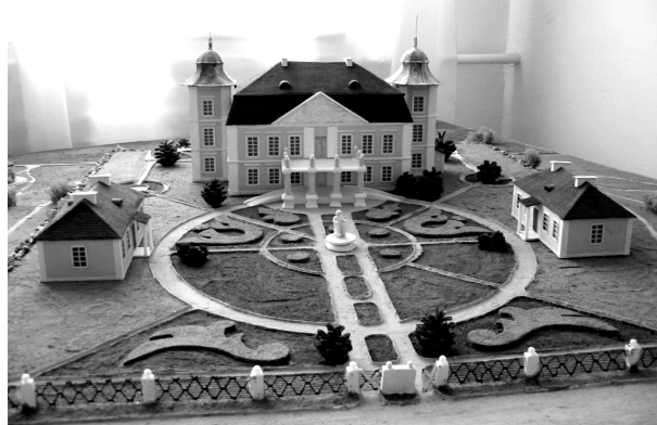
Рис. 2. Предложение реконструкции усадьбы Ю.Немцевича в д. Скоки (Брестский р-он) под культурно-образовательный комплекс. Дипломный проект