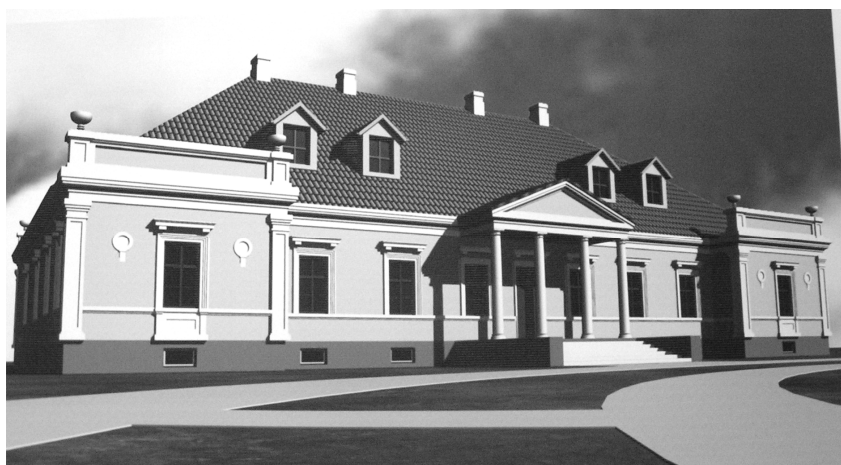
Рис. 3. Предложение реставрации с созданием туристского комплекса усадьбы в д. Гремьяче (Камянецкий р-он). Дипломный проект