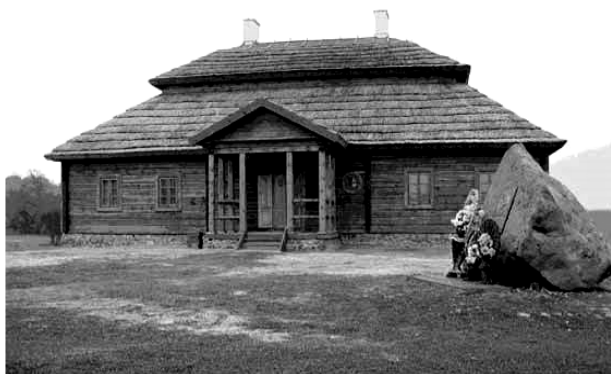
Рис. 1. Восстановленная усадьба Т.Костюшко в ур. Меречевщина (Ивацевичский р-он)