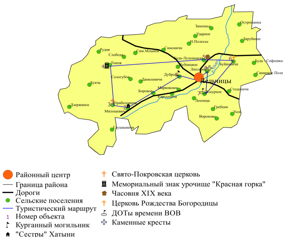
Рисунок 2 – Экскурсионный маршрут «Тропами Лельчицкого края»

В разработанный маршрут вошли объекты: Курганный могильник (д. Дуброва) (1), «Сестры» Хатыни (д. Милошевичи) (2), Свято-Покровская церковь (д. Приболовичи) (3), мемориальный знак урочище «Красная горка» (д. Тонеж) (4), Часовня XIX века (Буда-Лельчицкая) (5), Церковь Рождества Богородицы (д. Буйновичи) (6), два ДОТа времен Великой Отечественной войны (д. Буйновичи) (7), каменные кресты (д. Липляны) (8).