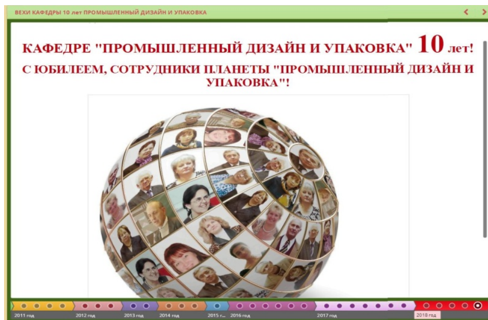
Рисунок 3 – Временная шкала «Вехи кафедры»

Интерактивные ленты времени сокращают время освоения материала, оптимизируя учебную деятельность за счет структурирования, четкости материала, предотвращают отставание пропустивших занятия, предоставляют дополнительные материалы для повышения уровня развития студентов, усиливают мотивацию за счет индивидуальных настроек, адаптации, разных видов эмоционального восприятия информации; формируют информационную культуру, создают возможности для контроля и коррекции образовательного процесса [2].