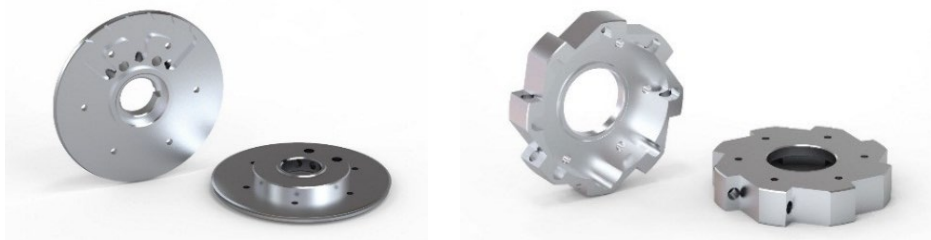
Рисунок 1 – 3D-модели крышки и чаши сопловой

3D-модели некоторых спроектированных деталей представлены на рисунках 1 и 2.