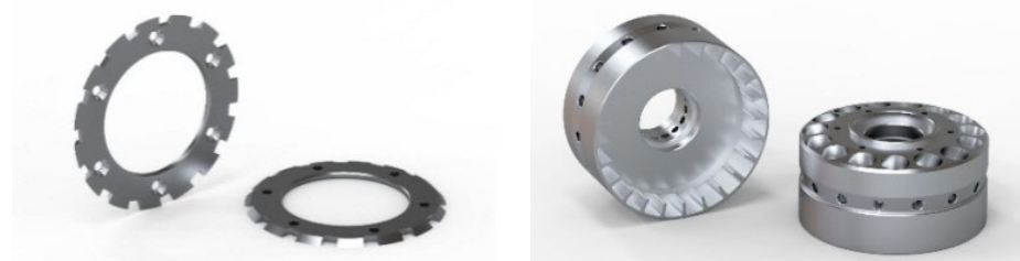
Рисунок 2 – 3D-модели кольца ограничительного и маховика