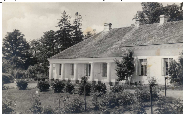
Іл. 2. Маёнтка Воля перад 1939 г.