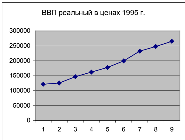
Рис. 1. График динамики реального ВВП.

Для того, чтобы наглядно отобразить результаты выполненного анализа динамики показателей ВВП, используем графический метод. Изобразим графики динамики макроэкономических показателей за анализируемый период.