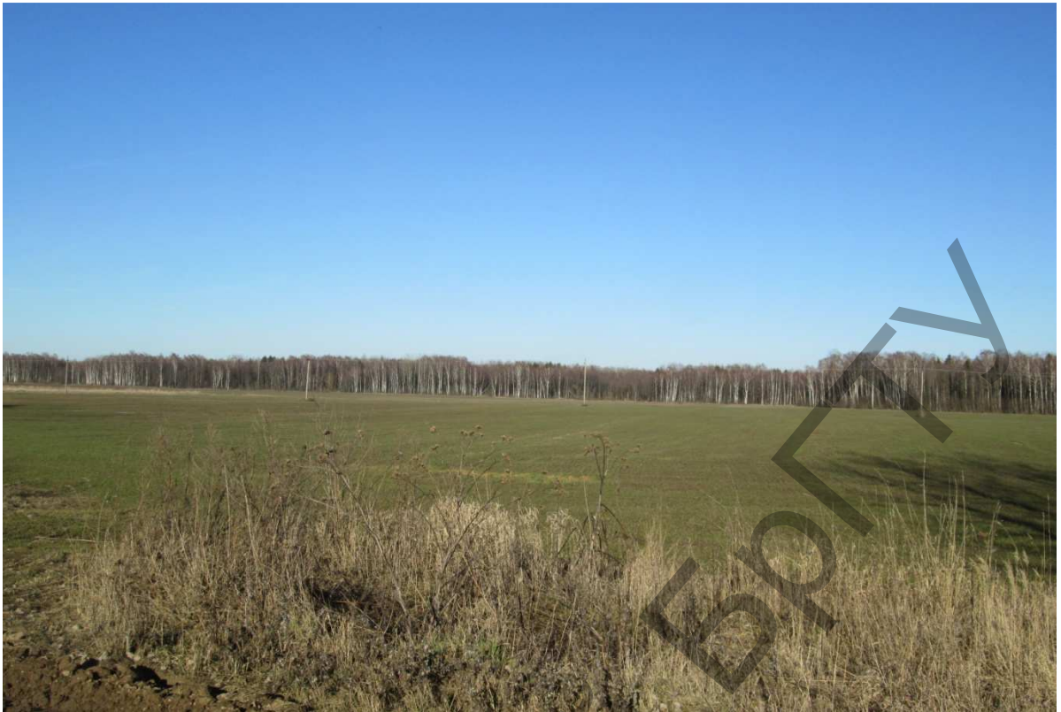
“Поле Доблести” перед деревней Вилейты, место ожесточенных боев 21–22 марта 1916 года. Фотосъемка через 100 лет в марте 2016 года во время похода по Поставскому району