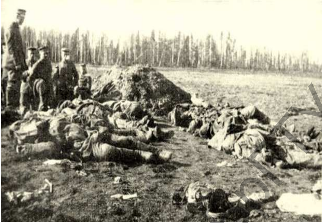
Снимок из фотоальбома 232-го пехотного полка «Германские санитары хоронят павших русских солдат около д. Интока Поставского района на "Поле Смерти" в апреле 1916 года»