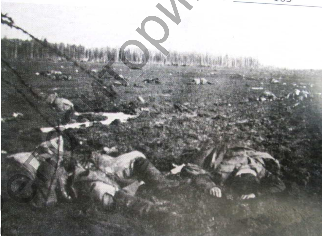
Снимок из фотоальбома 232-го пехотного полка «Погибшие русские солдаты на "Поле смерти" под д. Интока Поставского района»