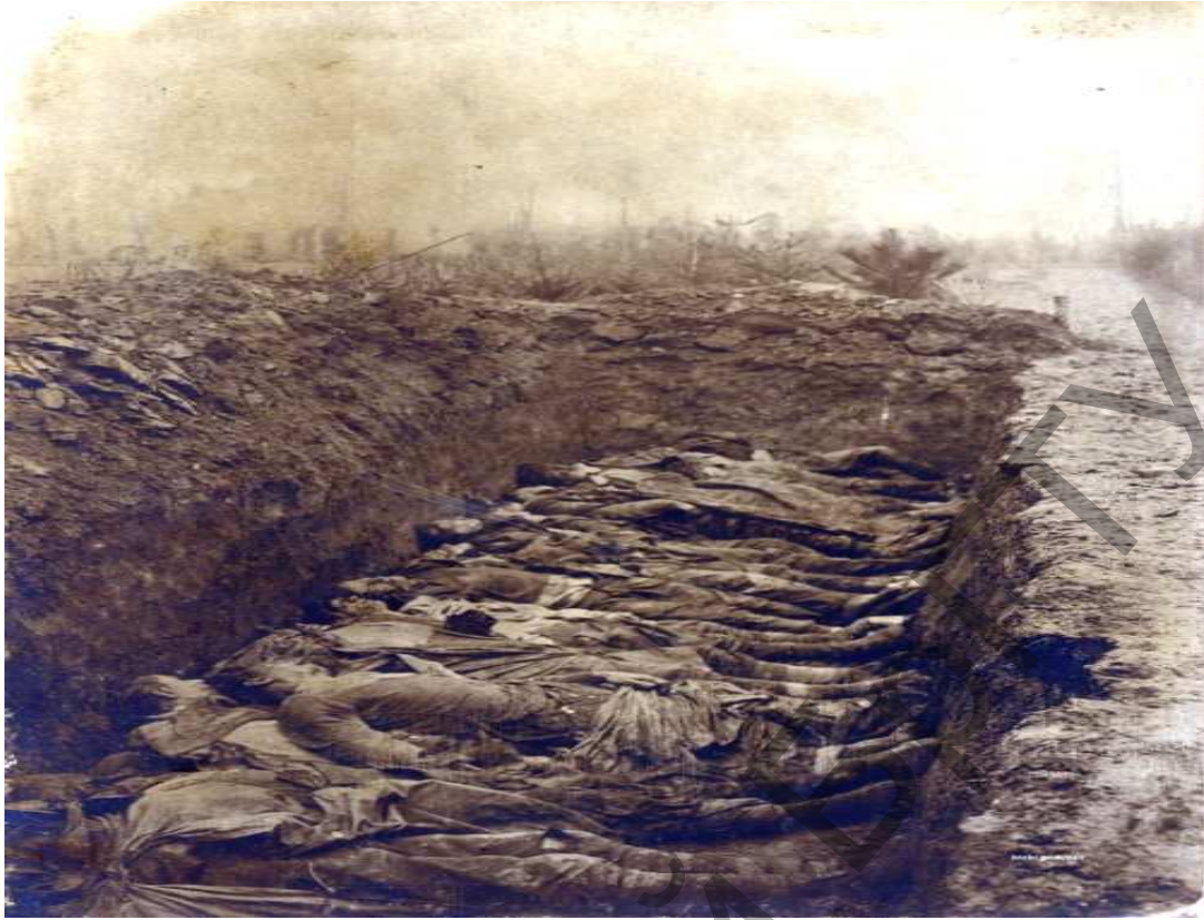
Захоронение павших русских солдат на опушке леса перед д. Бучелишки около “Леса Ивана” Поставского района (из полковой книги 232 полка германской армии)