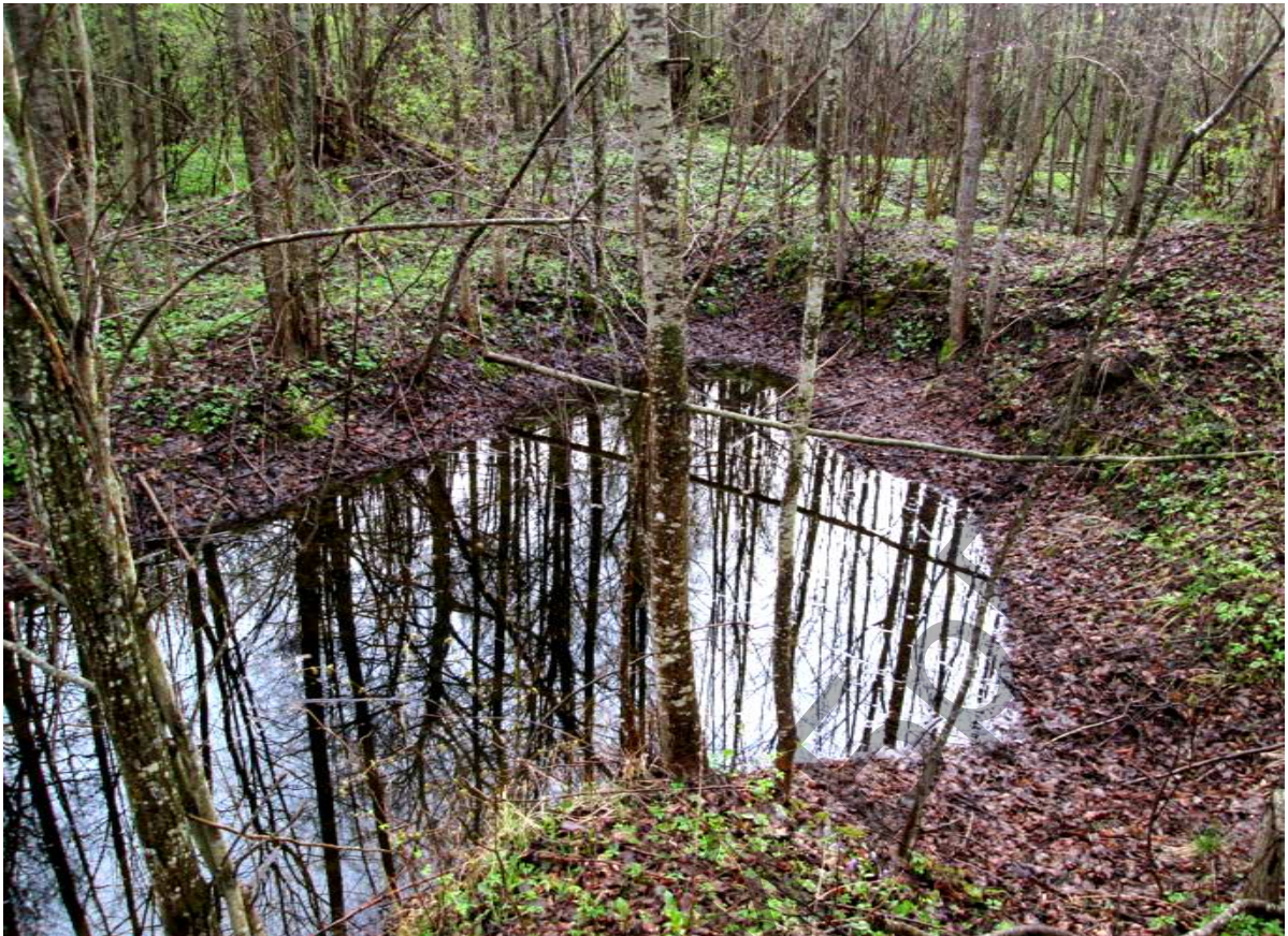
На "Просеке Муля" в марте 2016 года