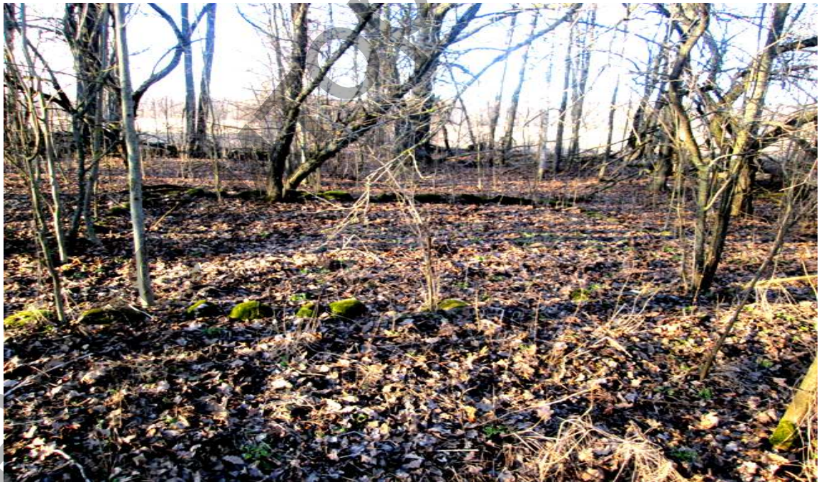
Предположительно братская могила русских солдат, погибших около “Леса Ивана” рядом с д. Бучелишки. Просматривается “Поле Смерти”, март 2016 г.