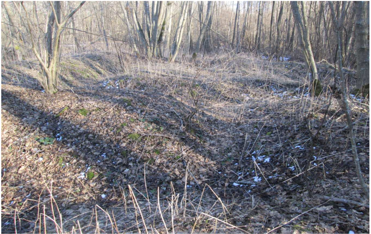
“Лес Гинденбурга” в марте 2016 года под д. Вилейты