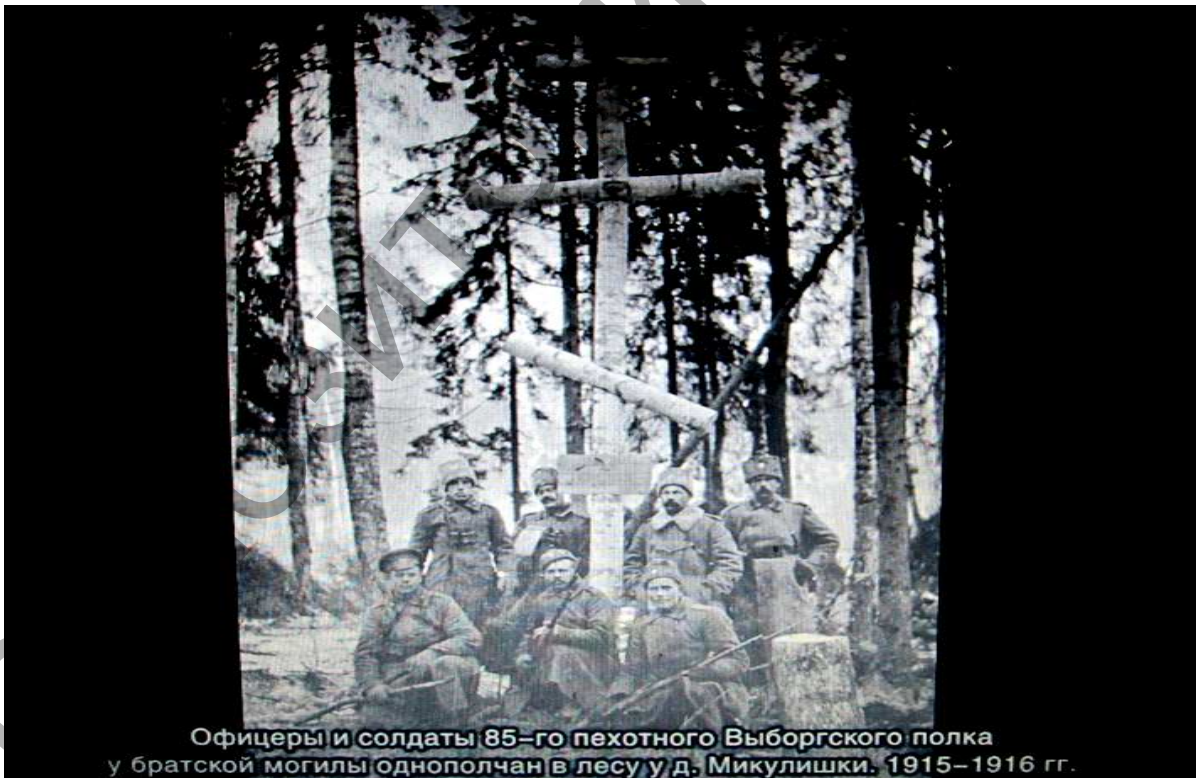
Офицеры и солдаты 85-го пехотного Выборгского полка у братской могилы однополчан в лесу у д. Микулишки. 1915–1916 гг.