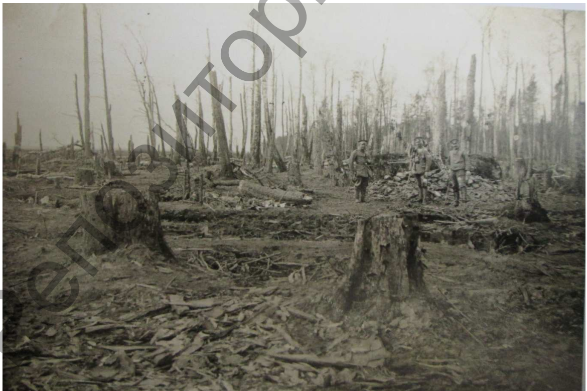
“Лес Гинденбурга” после мартовских боев 1916 года