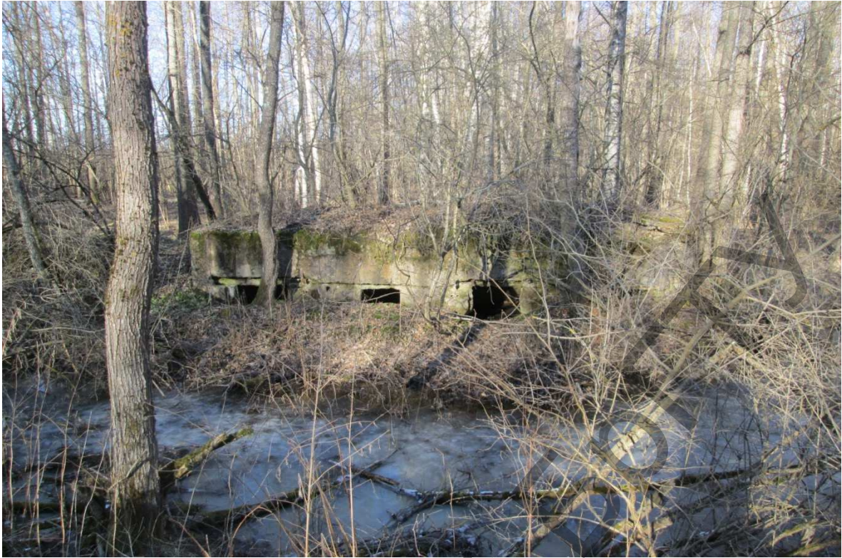
“Болото мертвецов” между д. Вилейты и бывшей д. Микулишки. Все болото пересекает линия укреплений, вросших в землю. Март 2016 года