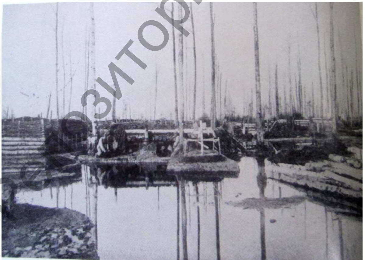
"Просека Муля" в марте 1916 года