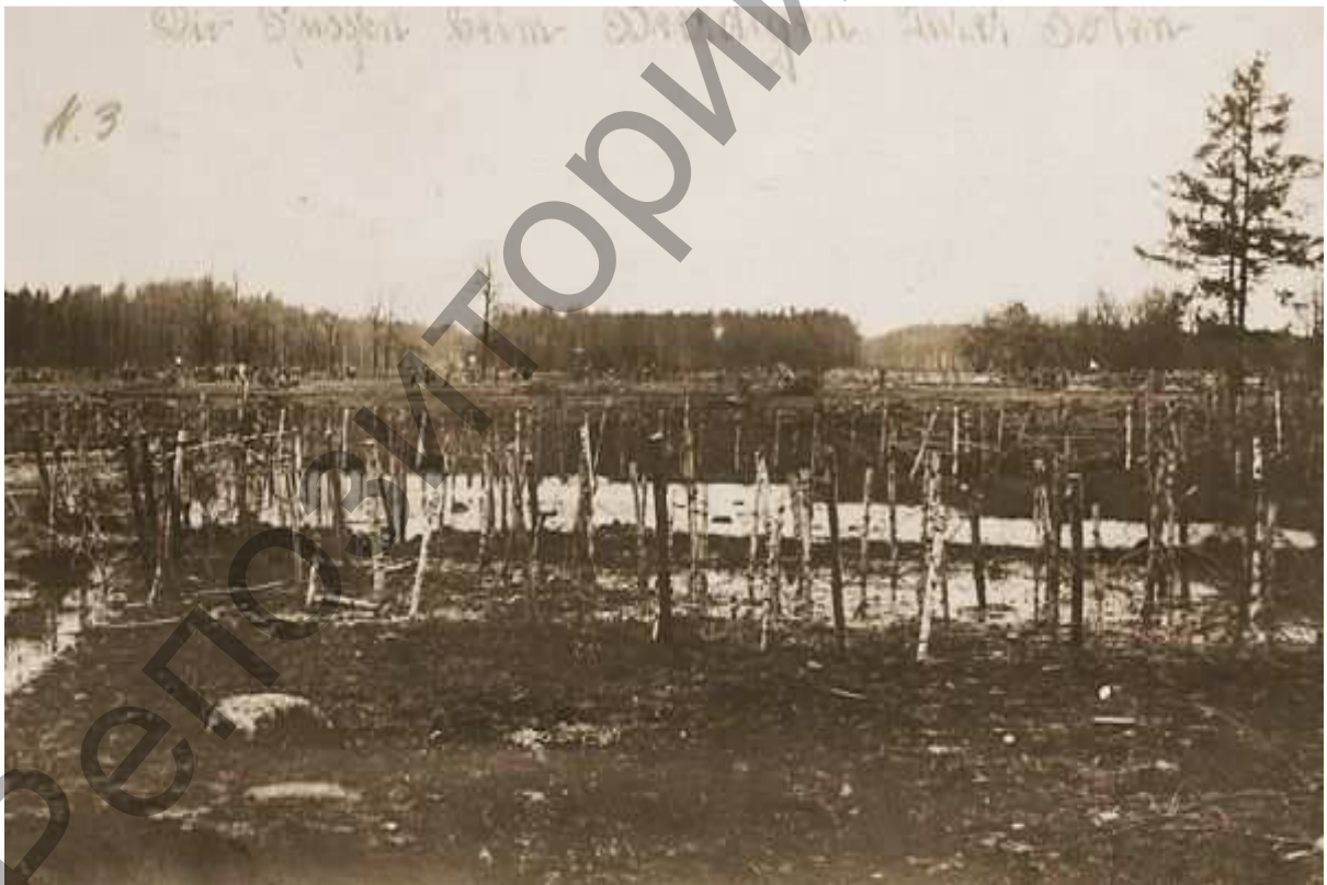
Пространство между германскими позициями “Лес Гинденбурга” и русскими позициями. Апрель 1916 года. Русские солдаты собирают тела павших товарищей в ходе мартовского наступления в районе д. Вилейты Поставского района