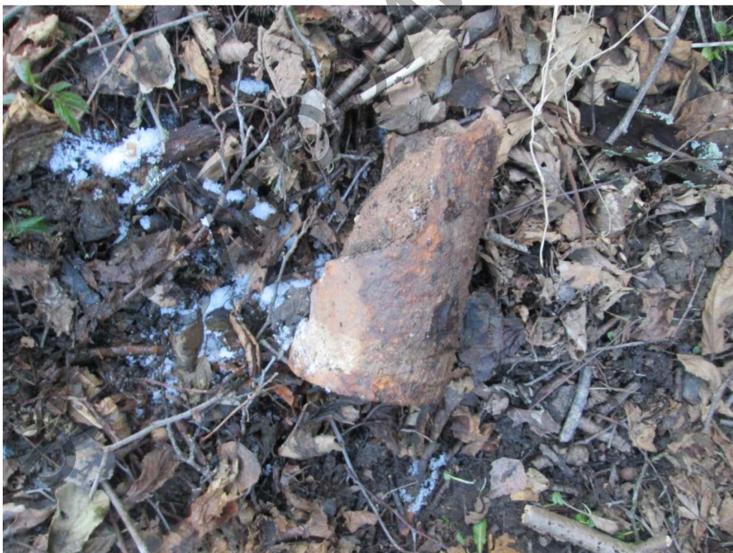
Бывшая линия фронта "Лес Гинденбурга" в районе Вилейты – Мажейки Поставского района