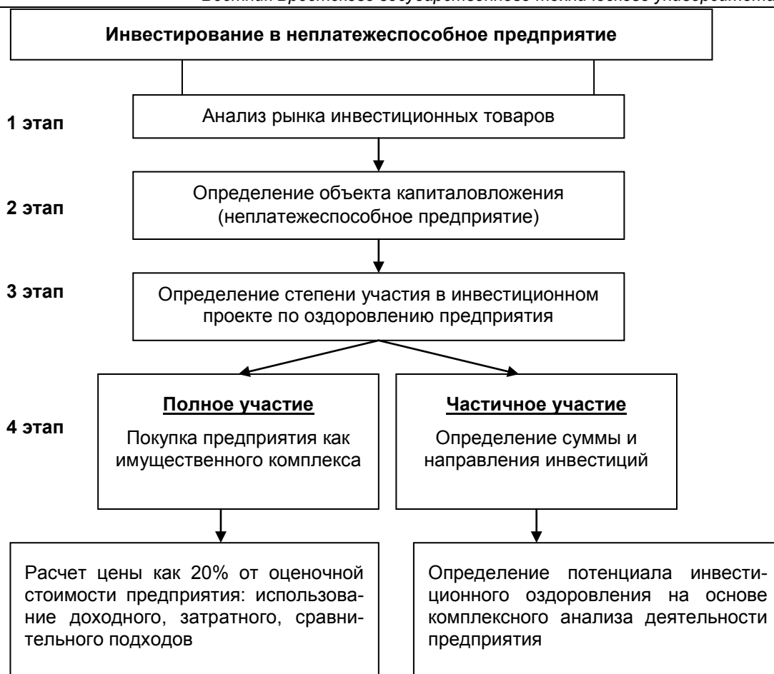
Рис. 2. Инвестирование в неплатежеспособное предприятие

сделки, не должен превышать календарного года. В начальную цену продажи дополнительно включается плата за право заключения договора аренды земельного участка.