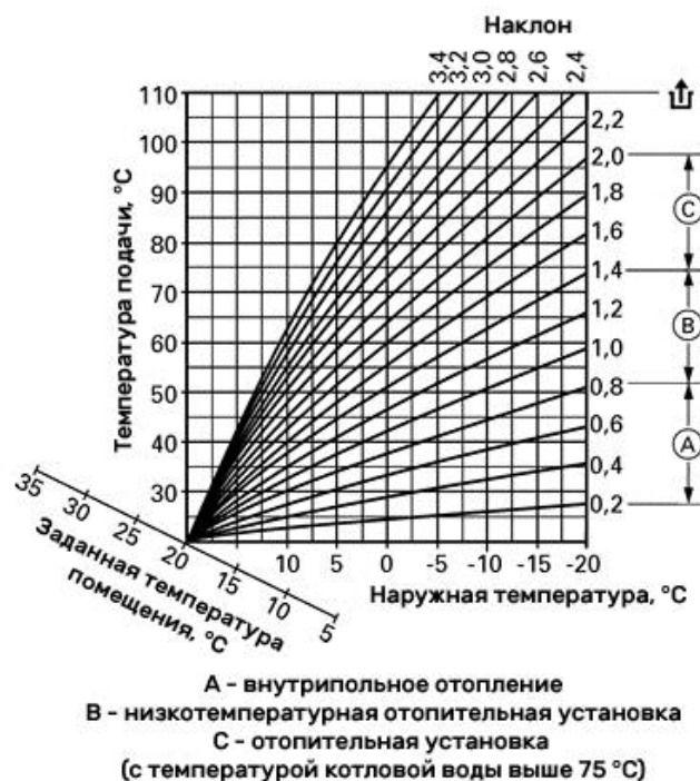
Рисунок 1 – Графическое представление алгоритма работы погодозависимой автоматики на примере контроллера погодозависимого цифрового программного управления котловым и отопительными контурами Vitotronic 300-KW3

Недостатки погодозависимой автоматики: высокая цена, затратный ремонт и техническое обслуживание, инерционность отопительного контура.