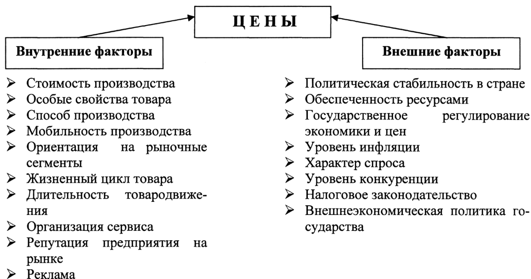
Рис. 1. Влияние факторов ценообразования на цены фирмы