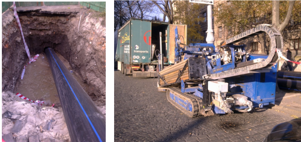
Рисунок 3 - Прокладка полиэтиленовых водопроводных труб DN 400 в г. Харькове методом горизонтального бурения

Горизонтальное бурение предусматривает опережающую разработку грунта в забое с устройством скважины в грунте большого диаметра, чем прокладываемая труба. Этим способом можно устраивать подземные переходы трубопроводов диаметром до 1720 мм на длину 70–80 м. Однако способ этот недостаточно эффективен в обводненных и сыпучих грунтах (опыт производства работ данным методом в г. Харькове приведен на рис. 1)