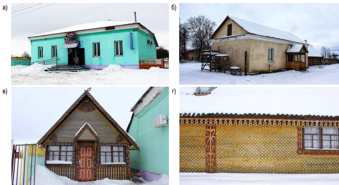
а – станционный дом, б – ямщицкая, в, г – новое строение служебного назначения