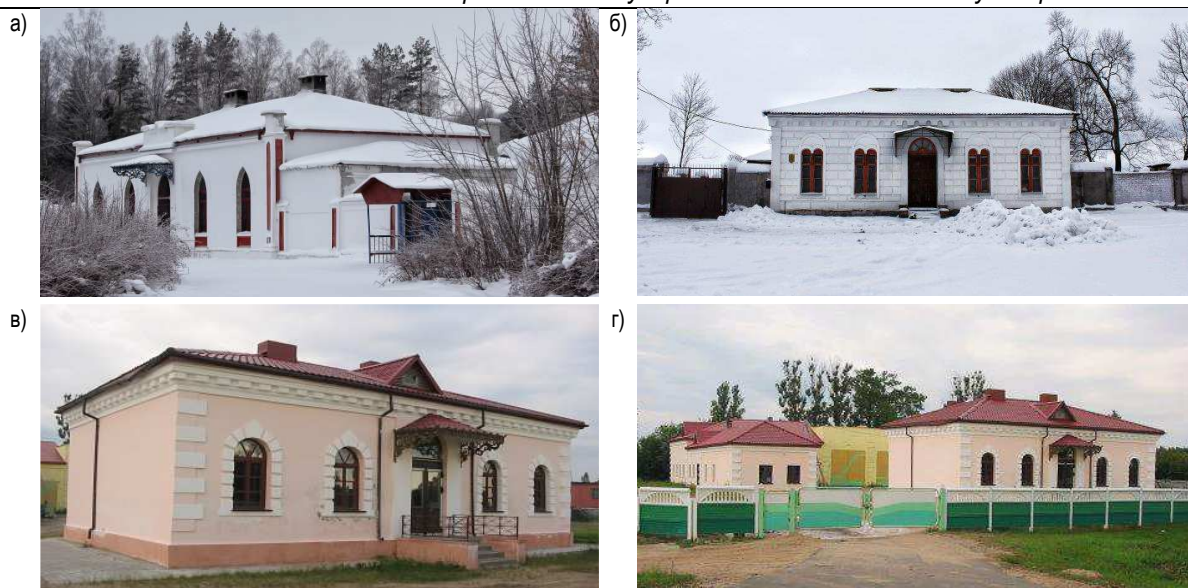
а – в д. Сидоровичи, б – в д. Фойно, в, г – в д. Локути Рисунок 1 – Примеры сохранившихся почтовых станций в Могилевской области