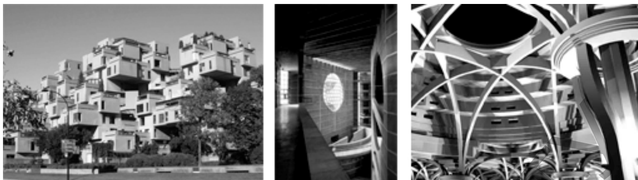
Рис. 3. М. Сафди (Habitat'67, 1966–1967 гг.), Л. Кан (Национальная ассамблея, 1962–1986 гг.), П. Портогези (дом в Риме, 1970 г.)

обещала возможность синтеза многообразных знаний. С конца 50-х годов активизируются и творческие поиски сложных пространственных форм. «Habitat '67» М. Сэфди, пластические композиции Дж. Иохансена, барочная пластика П. Рудольфа и глубокая артикулированность объёмно-пространственных композиций Л. Кана, стремление к пространственной сложности и противоречивости в работах Р. Вентури, П. Портогези и других архитекторов создали предпосылки и обусловили потребность более емкого и выразительного способа осмысления пространства в теории архитектуры (рис. 3) [5].