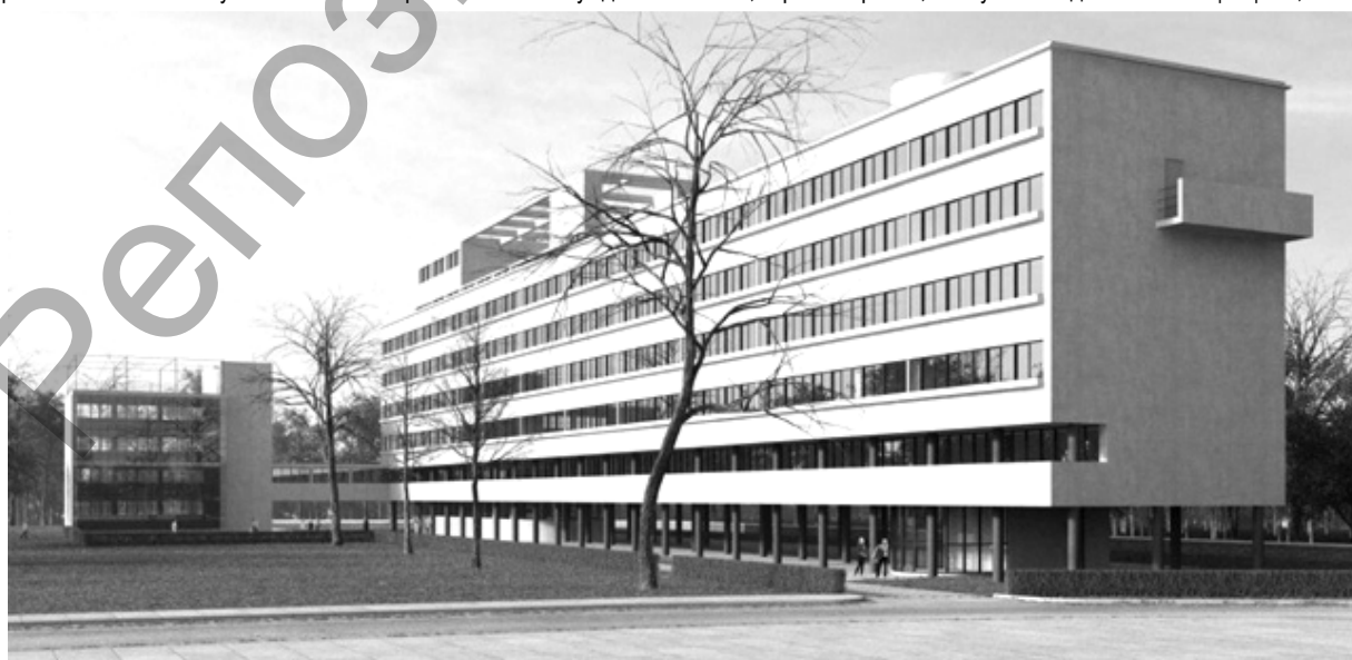
Рис. 2. Дом Наркомфина (1930 г., арх. М. Гинзбург, И. Милинис)

Интерес к проблемам пространства в конце 50-х – начале 60-х годов оказался тесно связан с миром научных представлений. Во-первых, встал вопрос о специфике профессионального архитектурного мышления, захваченного многообразием научных предметов. Во-вторых, категория «пространство», инвариантная многим научным, философским, искусствоведческим концепциям, казалась,