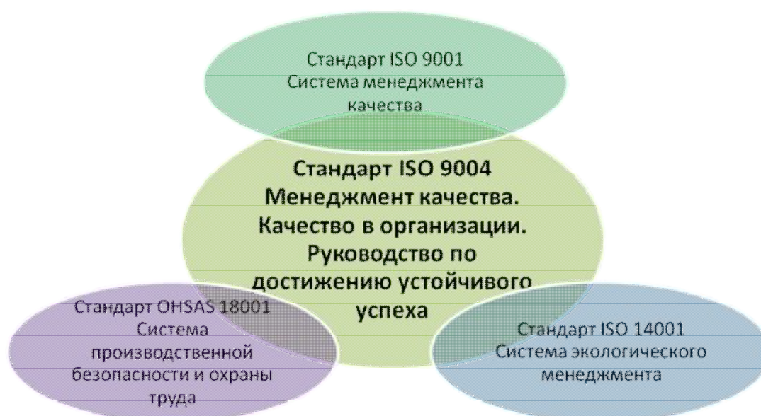
Рисунок 4 - Интегрированная система менеджмента

Грамотное сочетание систем позволяет обеспечить формирование и внедрение интегрированных систем менеджмента: