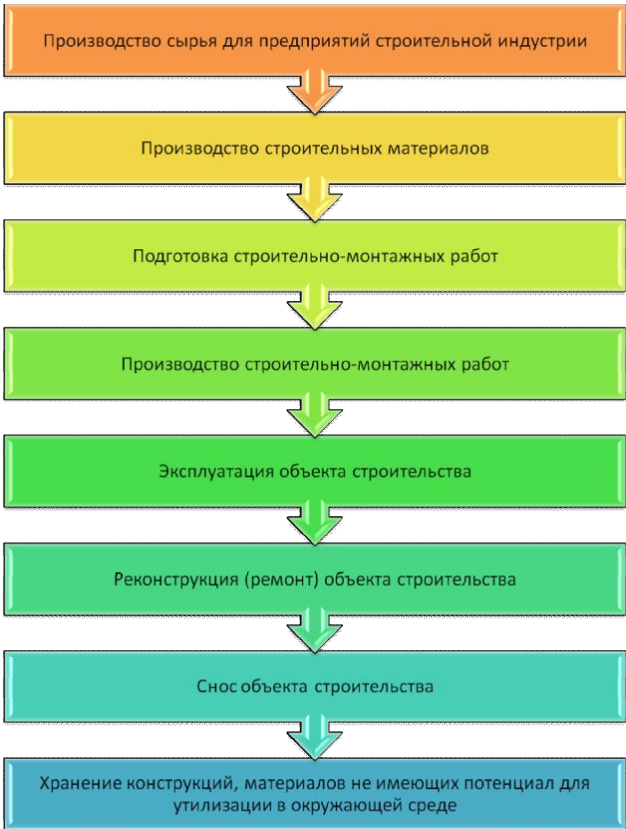
Рисунок 2 - Этапы влияния строительного производства на экологию