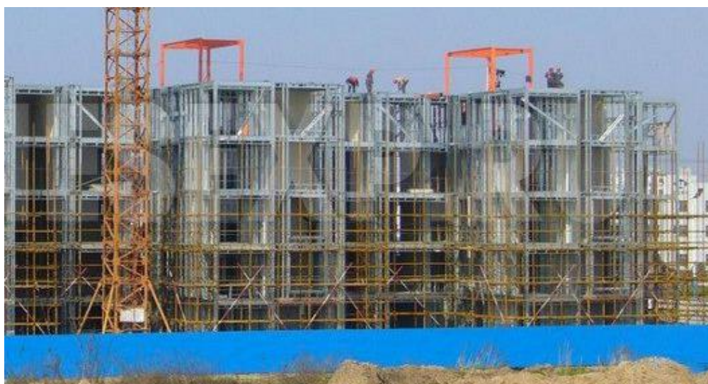
Рисунок 1 – Несущий каркас жилого здания из ЛСТК

Сегодня технология ЛСТК при возведении несущего каркаса зданий и сооружений различного назначения широко применяется в Великобритании, США, Японии, Финляндии и др. и набирает популярность в России (рис. 1). Вызвано это следующим. Тонкостенные конструкции примерно на 50% легче, а значит и дешевле по сравнению с черным металлом. С учётом снижения веса конструкций снижается стоимость работ по монтажу металлоконструкции. Отсутствие мокрых процессов позволяет выполнять строительство круглогодично, при любой погоде.