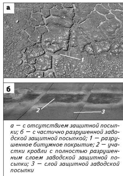
Рис. 1. Техническое состояние верхнего слоя рулонного водоизоляционного ковра эксплуатируемой кровли

а — с отсутствием защитной посыпки; б — с частично разрушенной заводской защитной посыпкой; 1 — разрушенное битумное покрытие; 2 — участки кровли с полностью разрушенным слоем заводской защитной посыпки; 3 — слой защитной заводской посыпки