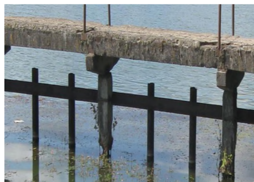
Рисунок 2 – Разрушение опор пешеходного мостика на трубчато-ковшовом водосбросе водохранилища Кутовщина Барановичского района Брестской области (2023 г.)

Процессу разрушения бетона подвержены как сборные железобетонные конструкции, изготавливаемые в промышленных условиях, так и монолитные участки, бетонируемые в условиях производства работ. При обследовании ГТС во всех регионах Беларуси в 2008–2023 гг. выявлено, что наиболее подвержены разрушению участки монолитного бетона или конструкции из него, как следует из рисунка 3, на котором представлен стык выполненный из монолитного бетона тоннеля ковшового водосброса.