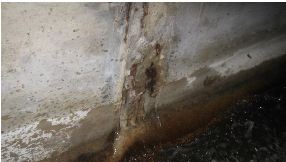
Рисунок 3 – Стык железобетонных труб, выполненный из монолитного бетона в тоннеле ковшового водосброса (водохранилище Кутовщина Барановичского района Брестской области, 2023 г.)

Это происходит в силу того, что достичь в производственных условиях требуемой плотности бетона практически не является возможным и пористость его выше.