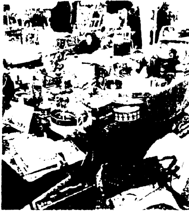
Arbeitsblatt II (b)