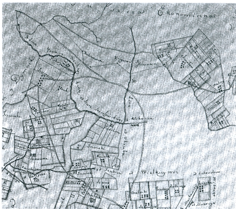
Рис. 2. Карта Пружанской губ. 1780 г. [Zb. kart. № 66-3. Ark. 11]