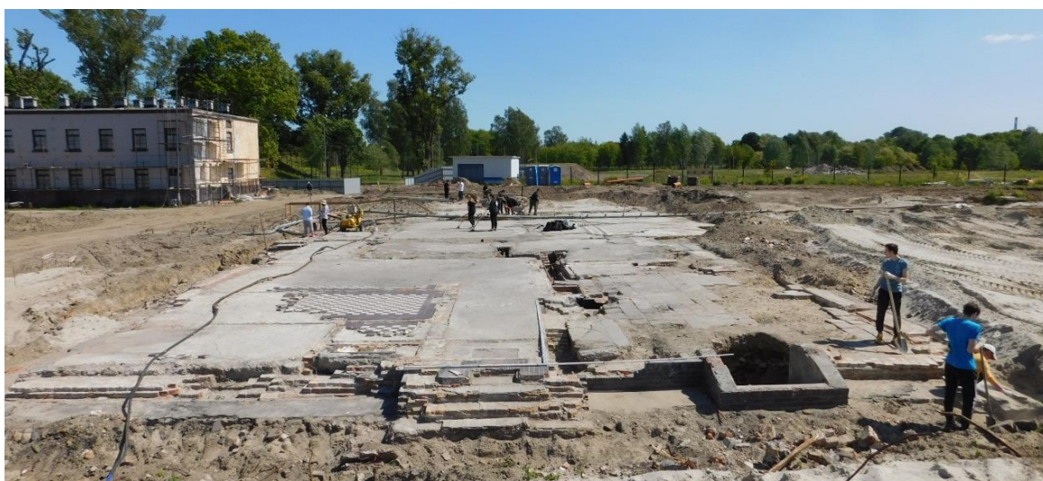
Рисунок 4 – Заключительный этап работ. Вид с запада

В результате установлены объективные размеры здания, которые составляют 15,7 \times 49,8 м. По углам здания (кроме юго-восточного) обнаружены бетонные водоприемники, для эффективного отвода сточных вод. Здание представляет собой два связанных прямоугольных объема. Западный объем представлял собой совокупность технических помещений столовой, включая подвальное помещение в юго-западном углу здания (засыпано крупно битым кирпичом), санузел с металлическим унитазом, вспомогательные помещения столовой, систему отопления (печь). Данные помещения занимали 1/3 внутреннего объема здания. В остальных 2/3 располагались: центральный зал для приема пищи с шестью несущими колоннами посередине, дополнительными помещениями (вероятно офицерские или банкетные залы), санузел с металлическим унитазом.