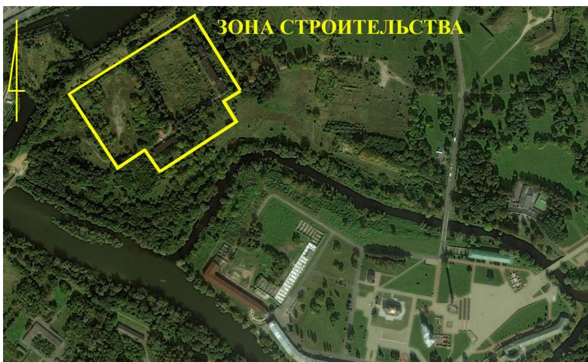
Рисунок 1 – Зона строительства на спутниковом снимке

этапе (июнь – август) археологические работы концентрировались с южной стороны от реконструируемых казарм. В результате было обследовано 1100 м 2 .