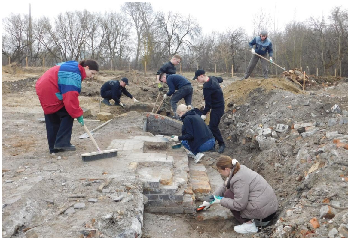
Рисунок 3 – Начальный этап археологических исследований. Зачистка западного фасада

В результате установлены объективные размеры здания, которые составляют 15,7 \times 49,8 м. По углам здания (кроме юго-восточного) обнаружены бетонные водоприемники, для эффективного отвода сточных вод. Здание представляет собой два связанных прямоугольных объема. Западный объем представлял собой совокупность технических помещений столовой, включая подвальное помещение в юго-западном углу здания (засыпано крупно битым кирпичом), санузел с металлическим унитазом, вспомогательные помещения столовой, систему отопления (печь). Данные помещения занимали 1/3 внутреннего объема здания. В остальных 2/3 располагались: центральный зал для приема пищи с шестью несущими колоннами посередине, дополнительными помещениями (вероятно офицерские или банкетные залы), санузел с металлическим унитазом.