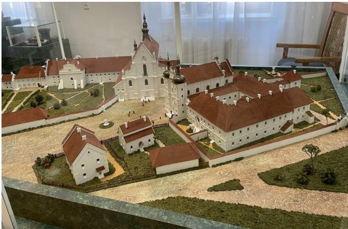
Рисунок 1 – Макет монастырского комплекса Бернардинцев и Бернардинок 1750 г. в г. Брест-Литовске, М 1:100 (авт. Власюк Н. Н., 1998 г., музей истории г. Бреста)