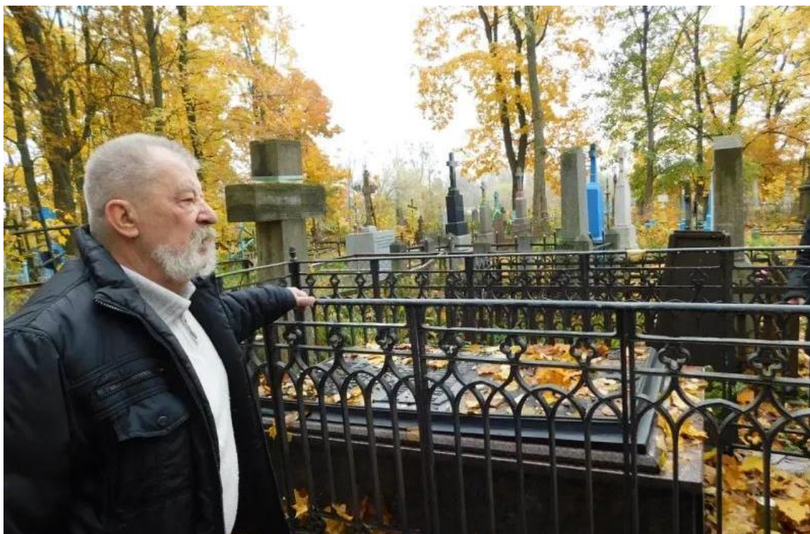
Рисунок 3 – Экскурсия по Тришинскому некрополю