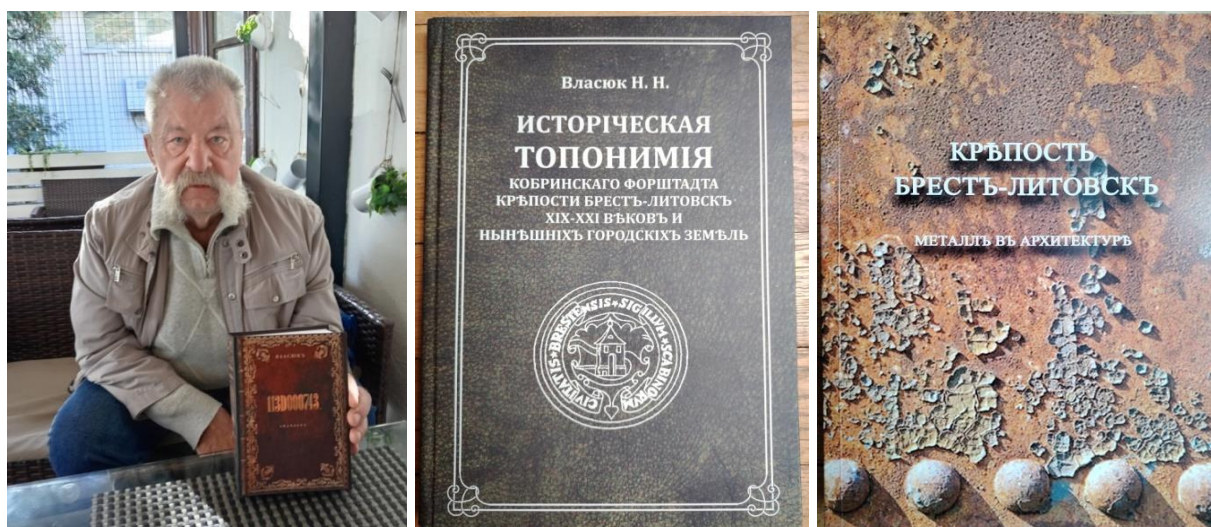
Рисунки 6-8 – Монографии Н. Н. Власюка – старшего

Переданные материалы имеют научно-практическую ценность, представляют интерес для специалистов и исследователей, занимающихся архитектурой г. Бреста, его исторической застройкой, краеведением. Опись содержит 12 единиц хранения (14 документов) за 1997, 2003–2010 гг. (фонд № 501, опись № 5, Государственный архив Брестской области). В 2020–2021 гг. выходят в свет два издания книги «Историческая топонимия Брест-Литовска», в 2021 г. – «Металл в архитектуре крепости Брест-Литовска», в 2023 г. – «Бедеккеръ Тришинского некрополя» (более 800 страниц!).