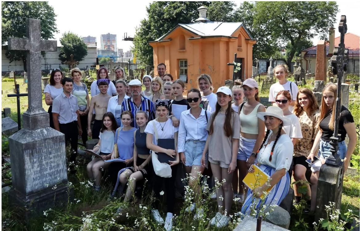
Рисунок 9 – Инвентаризация некрополя. Летняя практика со студентами специальности Архитектура на католическом кладбище г. Бреста

Не успел... «Прекрасный был человек», «Настоящий патриот, удивительный исследователь», «Хороший человек», «Это был самый лучший педагог» – такие слова звучали на прощании.