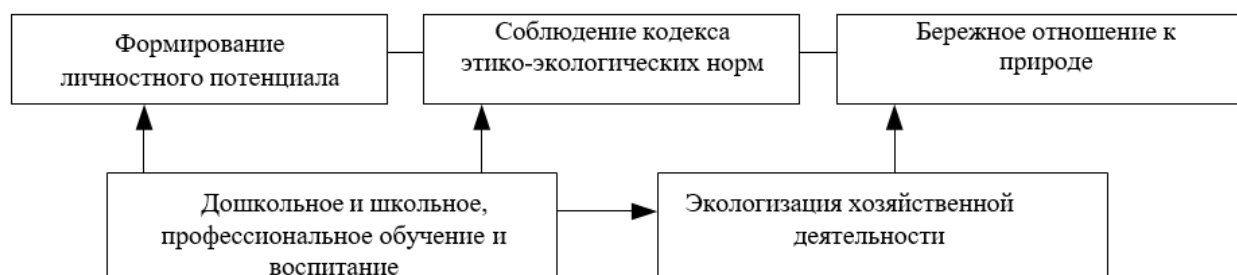
Рисунок 1 – Зависимость экологизации хозяйственной деятельности от личностного потенциала

Примечание – Источник: составлено автором на основе [2]