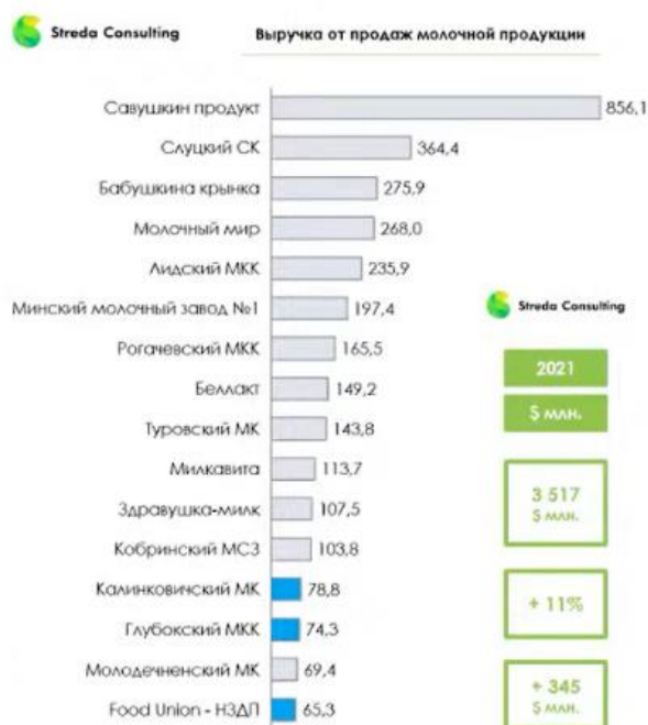
Рисунок 3 – Рейтинг молочных компаний Республики Беларусь по совокупной выручке в 2021 году в млн долл. [9]

На рисунке 3 представлен рейтинг крупнейших молочных компаний Беларуси [9].