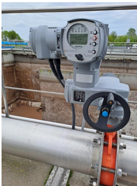
Рисунок 3 – Дисковый поворотный межфланцевый затвор с электроприводом AUMA SA и блоком управления AUMA AC 1.02

Для регулирования расхода воздуха, подаваемого в реконструируемые аэротенки №№ 1, 2, выполнена установка на системе воздухоснабжения тепловых массовых расходомеров воздуха t-mass Proline t-mass B150 HARD и дисковых поворотных межфланцевых затворов с электроприводом AUMA SA и блоком управления AUMA AC 1.02 (рисунок 3). Автоматизация подачи воздуха в аэротенках осуществляется по концентрации растворенного кислорода, измеряемой датчиками растворенного кислорода Oxumax COS61D. В целом, внедрение автоматизированной системы управления оптимизирует процесс очистки и сокращает трудовые ресурсы.