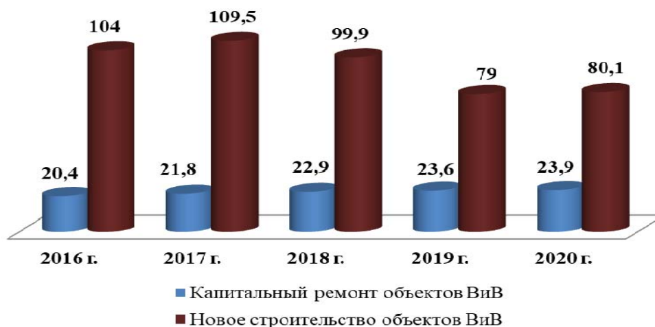
Рис. 2. Потребность в инвестициях в инфраструктуру Республики Беларусь по годам, млн.долл. США

Потребность в привлечении дополнительных средств в развитие инфраструктуры привела к поиску механизмов, которые позволили бы снизить нагрузку на бюджет и использовать преимущества частного бизнеса. Было принято решение о развитии в Республике Беларусь государственно-частного партнерства (ГЧП).