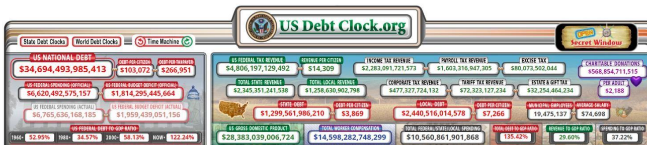
Рисунок 2 – Показатели госдолга США [9]

Давайте все же не будем забывать о растущем госдолге США (см. рисунок 2 слева вверху). На самом деле это и есть феноменальный рост госдолга, который давно оказывает и будет оказывать серьезное влияние на многие экономические процессы по всему миру. Очевидно, что госдолг США уже вырос сегодня до таких размеров, что проблему нужно как-то решать, но как это сделать на сегодняшний момент, не знает никто. Конечно, еще какое-то время процесс может находиться как бы в замороженном состоянии, но как долго, сказать сейчас не берется никто.