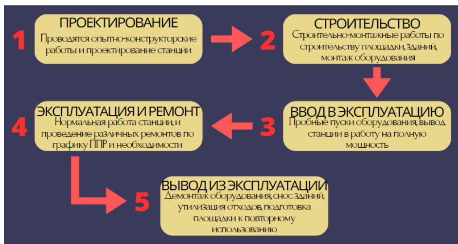
Рисунок 1 – Основные стадии жизненного цикла ТЭС

«Green controlling» позволяет охватить на предприятии такие направления как использование «чистого» сырья и материалов; экономия энергии, воды, сырья и прочих ресурсов; утилизация или вторичное использование отходов; уменьшение объемов вредных выбросов, в особенности углекислого газа. Большая часть экономии энергетических ресурсов будет достигаться с помощью современных, перспективных и энергосберегающих технологий, а также оборудования и материалов. Концепция «зеленого контроллинга» позволит не только обеспечить более экологически чистое производство, но и возьмет на себя управление ресурсами и анализ распределения ТЭР. На наш взгляд, наиболее эффективно применение грин-контроллинга на отдельных стадиях жизненного цикла теплоэлектростанции [3]. Весь жизненный цикл ТЭС можно разделить на 5 этапов. Более подробно стадии ЖЦП станции представлены на рисунке 1.