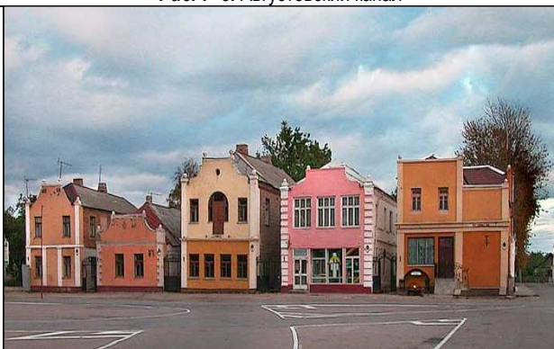
Рис. 10. Историческая застройка центральной части малых городов