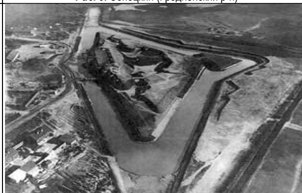
Рис. 11. Форт в г. Бресте, нач. XX в.

Территориальные границы историко-этнографических областей часто совпадают с прежними рубежами королевств, княжеств, иногда они совпадают с физико-географическими областями и, видимо, были населены различными племенами еще в те времена, когда природный ландшафт имел большее значение для этногенеза. Для Беларуси это древние языческие племена дреговичей, ятвягов, кривичей и прочих.