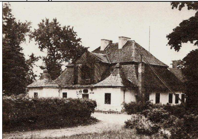
Рис. 4. Усадебный дом в Польше