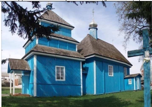
Рис. 5. Михайловская церковь XVIII в. в д. Ремель (Столинский р-н) Зодчество центрального Полесья