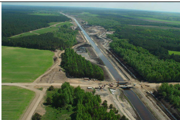
Рис. 7–8. Августовский канал