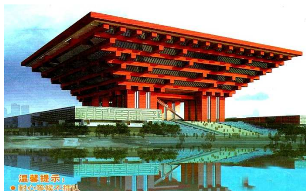
1. 温馨提醒: 耐心等候不排队

Регионализм проявляет себя в различных стилях, направлениях. Так, в Польше и Украине – стиль "закопаньский" (рис. 3–4), в западной Беларуси – стиль "народовы". Региональные отличия модерна в нач. XX в. в разных странах Европы – (Ар Нуво - в Бельгии, Сецессион – в Австрии, Югендстиль – в Германии, Либерти – в Италии и т.д.).