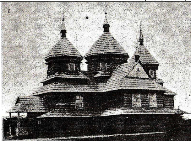
Рис. 3. Церковь на выставке краевой в 1894 году во Львове (Украина)