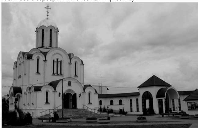
Рис. 2. Духовно-просветительский центр Белорусского Экзархата на базе прихода в честь иконы Божий Матери «Всех Скорбящих радость» в г. Минске

Совокупность вышеперечисленных черт свидетельствует о применении в архитектурном решении комплекса Свято-Елизаветинского монастыря приёмов, характерных для русской архитектуры XVII вв., в том числе и архитектуры «узорочья», что не противоречит каноническому пониманию храма. В "Песне песней" царя Соломона о Невесте (по христианскому вероучению, символизирующей Церковь) говорится следующее: "Прекрасны ланиты твои под подвесками, шея твоя в ожерельях; золотые подвески мы сделаем тебе с серебряными блестками" (Песн. 1).