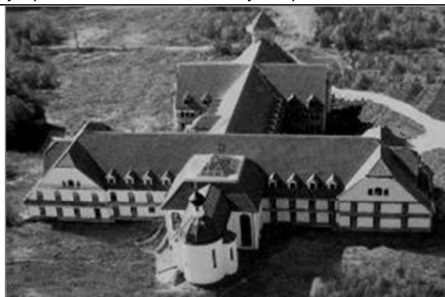
Рис. 5. Дом Милосердия в Минске

В составе Христорождественского комплекса в Солигорске находятся Христорождественский собор, Крестильная церковь, Водосвятная церковь, трапезная, воскресная школа и вспомогательные помещения. В архитектурном объёме комплекса различные по размеру и высоте пространства соединяются, перетекают друг в друга и завершаются системой куполов, отождествляясь со строем «Небесной Иерархии», создавая впечатление «непрерывного движения», описанного Дионисием Ареопагитом. Архаизация элементов византийской архитектуры, их массивность, аскетичность внешнего облика привели к очень выразительному и своеобразному архитектурному решению.