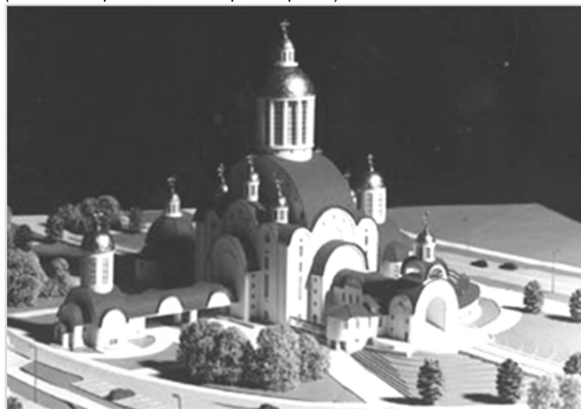
Рис. 4. Христо-Рождественский православный комплекс в г. Солигорске

Храмы-памятники в г. Минске, Бресте имеют компактную планировочную структуру. Например, в храме на ул. Калиновского в г. Минске, который является самым крупным из них, в нижних этажах размещены художественные мастерские, помещения школы, актовый зал, кабинеты настоятеля, комнаты для священства и т.д. В подземном уровне расположена крипта. Непосредственно зал церкви расположен в одном уровне с гульбищем. Возможно размещение этих функций (кроме крипты) как в отдельно стоящих зданиях (кафедральный собор в г. Гродно), так и в нижних ярусах колокольни (Свято-Воскресенский собор в г. Бресте).