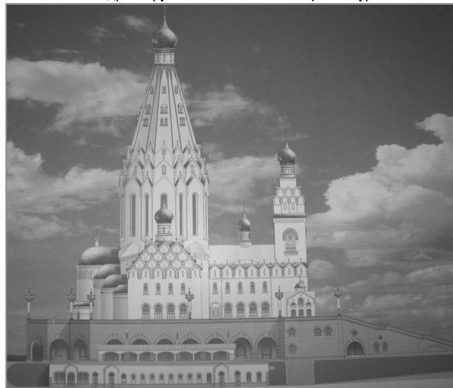
Рис. 3. Храм-памятник в честь Всех Святых в г. Минске

Общее решение Духовно-просветительского центра Белорусского Экзархата на базе прихода в честь иконы Божий Матери «Всех Скорбящих радость» в г. Минске близко традиционной пространственной организации древнебелорусского и древнерусского монастыря. Храм в честь иконы Божией Матери «Всех скорбящих Радость», располагаясь в центре участка, находится на пересечении пространственных осей, так как на него выводят основные входы на территорию центра. Свято-Ефросиньевская церковь, вместе с блоком воскресной школы, зданием мастерских и других вспомогательных сооружений формирует периметральную фоновую линию застройки по отношению к собору. В архитектурном решении соборного храма и крестильной церкви применены мотивы древнерусской и византийской архитектуры.