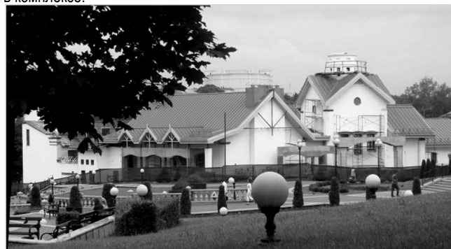
Рис. 6. Духовно-образовательный центр в г. Минске

Духовно-образовательный центр в г. Минске по ул. Немига в настоящее время находится в стадии строительства. Он представляет собой комплекс сооружений, выстроенных по периметру трапециевидного участка, и включает, кроме здания церкви, ректорат, учебные корпуса с аудиториями, актовым залом, библиотекой и столовой, а также здание общежития. Храм духовно-образовательного центра располагается в пределах центральной части территории, и хотя он не является крупным сооружением, встраиваясь и подчиняясь общему объёмному решению комплекса, его особенное расположение подчёркивает его статус и значение его в комплексе.