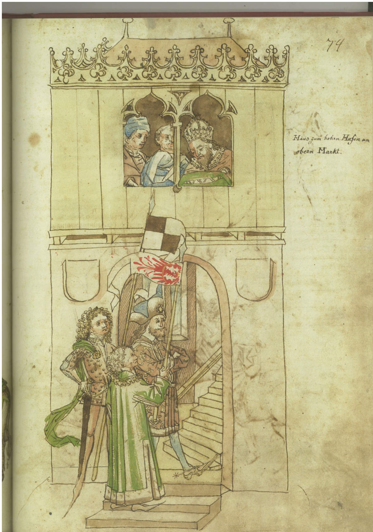
Рисунок 2 – Бургграф Фридрих Нюрнбергский с двумя своими знаменосцами у дома У Высокой Пристани. Вверху у окна король Сигизмунд. [Ulrich Richental. Chronik des Konzils zu Konstanz 1414 – 1415 / Faksimile der Konstanzer Handschrift. Mit einem Nachwort von J. Klöckler. – Darmstadt : Theiss, 2015. – Folio, 74 REC].