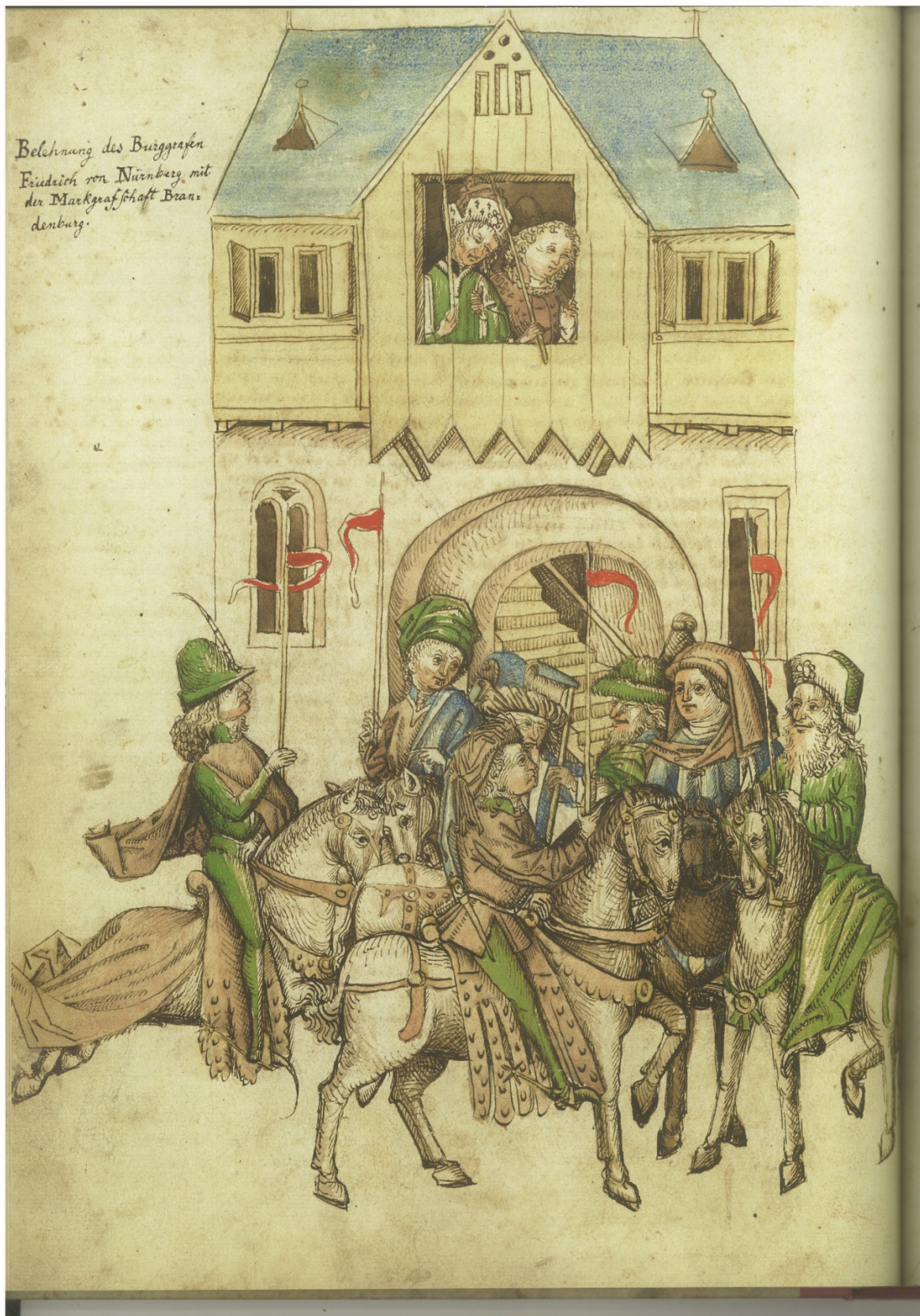
Рисунок 1 – Всадники едут по городу с красными флажками. [Ulrich Richental. Chronik des Konzils zu Konstanz 1414 – 1415 / Faksimile der Konstanzer Handschrift. Mit einem Nachwort von J. Klöckler. – Darmstadt : Theiss, 2015. – Folio, 73VERS].