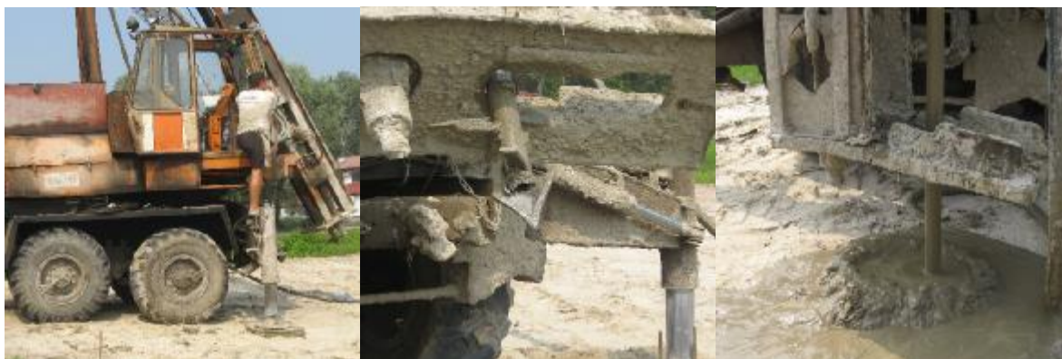
Рисунок 1 – Суть буросмесительной технологии: буровая установка перемещена к местоположению очередной сваи (слева), буровая труба с ножами устанавливается вертикально острием в центре изготавливаемой сваи (посередине), производится бурение на необходимую глубину сваи (справа)

Буросмесительная технология [2, 3] состоит в перемешивании грунта с цементным раствором прямо в месте расположения сваи (рис. 1).