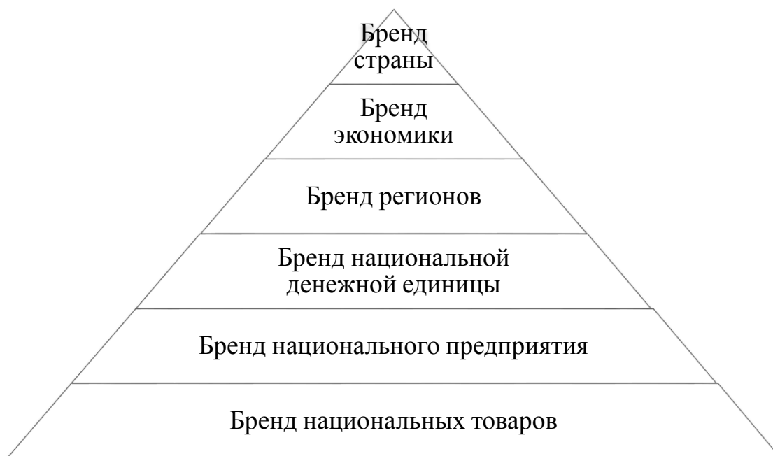
Рисунок 1 – Уровни формирования национального бренда

Успешность реализации бренда в основном определяется степенями узнаваемости и лояльности к нему субъектов извне. Так, разрабатываемый бренд отправляет импульсы во внешнюю среду, которые принимаются, рассматриваются и адаптируются соответствующим образом для того, чтобы запустить ответные реакции и действия [3].