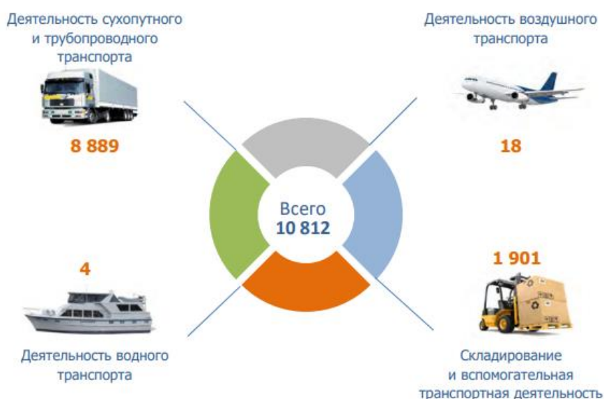
Рисунок 1 – Количество зарегистрированных организаций на территории Республики Беларусь

Объем логистических услуг, оказанных компаниями, составил в 2021 году 673,1 млн. рублей, что на 24,1 % меньше прошлогоднего показателя [2].