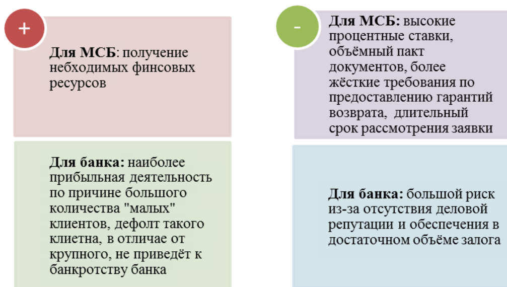
Рис. 1. Противоречия получения банковского кредита субъектами МСП

Важнейшая роль банков в развитии МСБ объясняется сложностью получения финансовых средств из других источников. Так по данным статистики, доминирующим источником привлечения капитала для отечественных предприятий малого и среднего бизнеса является банковский кредит, однако им охвачено лишь около 20 % субъектов. Необходимо отметить, что получение кредита МСБ – достаточно трудоемкое мероприятие, как со стороны заемщика, так и со стороны банка, однако можно выделить и ряд положительных сторон (рисунок 1):