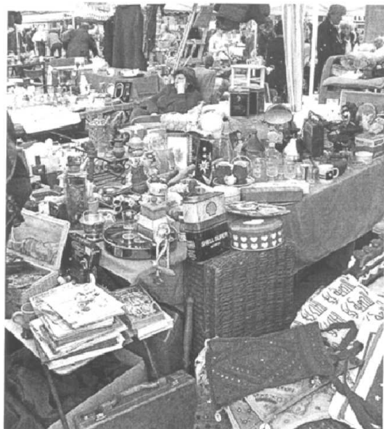
Arbeitsblatt II (b)