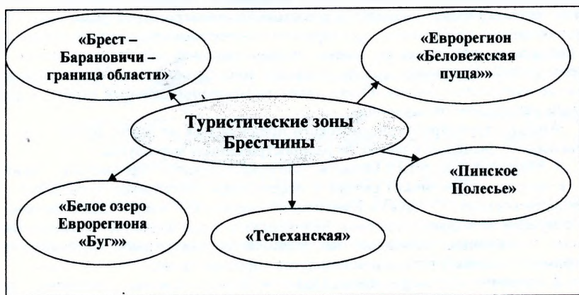
Рисунок 2.6 – Туристические зоны Брестской области

На данный момент в Брестской области создано 5 туристических зон: