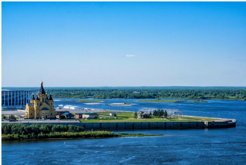
Фото 2 – памятник Александру Невскому рядом с собором

Сейчас собор восстановлен полностью, являясь главной достопримечательностью города.