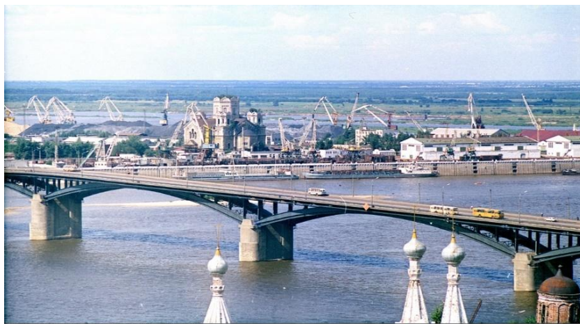
Фото 1 – Вид на собор Александра Невского (г. Горький, 70-е годы XX в.)

Сейчас собор восстановлен полностью, являясь главной достопримечательностью города.