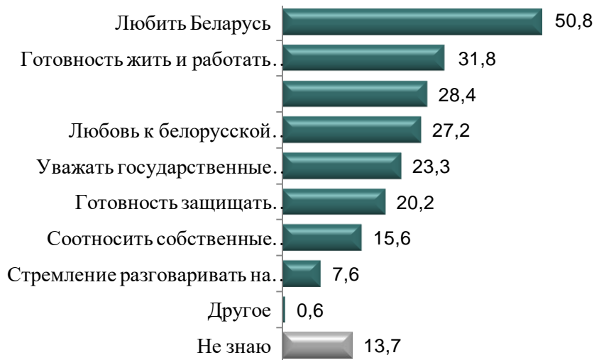
Рисунок 2 – Распределение ответов респондентов на вопрос: «Что для вас значит быть патриотом Беларуси?», %

уважать государственные символы (см. рисунок 2). Причем мужчины чаще, чем женщины (на 10,1 %), выражают готовность защищать Беларусь, даже рискуя собой. Молодые люди (до 25 лет) чаще выражают готовность к активной деятельности на благо Беларуси, а пожилые (старше 65 лет) указывают на необходимость жить и работать только в своей стране.