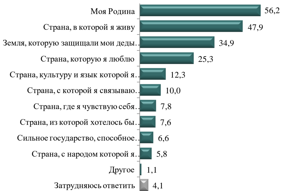
Рисунок 1 – Распределение ответов респондентов на вопрос: «Для меня Беларусь – это», %

Результаты исследования демонстрируют, что Республика Беларусь у ее жителей ассоциируется преимущественно с Родиной, страной, в которой они живут и ценят историческую память предков (см. рисунок 1). При этом респонденты старшего поколения (65 лет и старше) чаще, по сравнению с другими возрастными группами, выражают любовь к своей стране и ассоциируют ее с землей, которую защищали деды и прадеды (46,0 %).