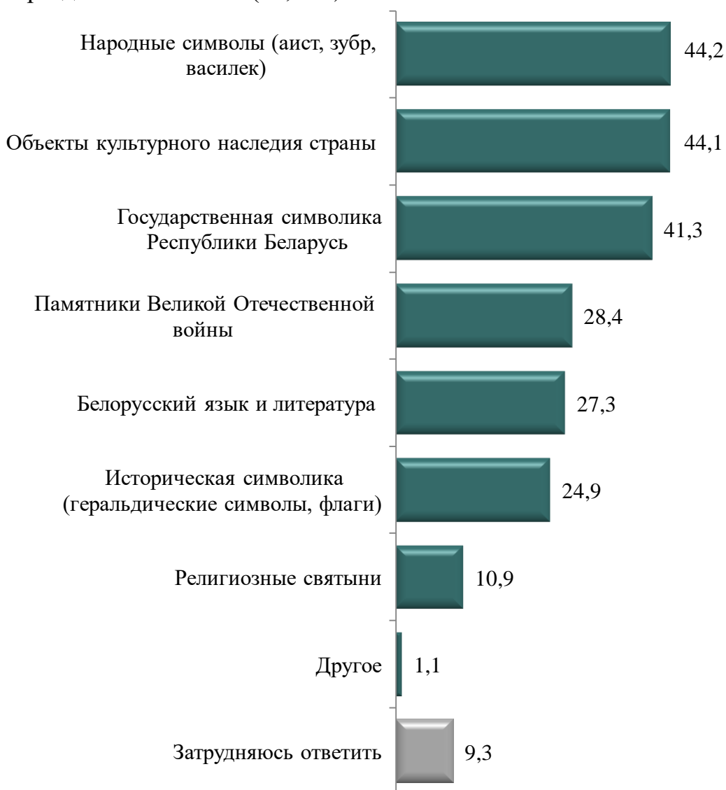
Рисунок 5 – Распределение ответов респондентов на вопрос: «Что, по вашему мнению, является главным символом национально-государственной идентичности белорусов?», %

Необходимо отметить, что государственная символика как главный символ идентичности белорусов воспринимается в качестве таковой преимущественно представителями поколения старше 65 лет (52,7 %). В возрастной группе до 25 лет она значима лишь для 35,4 % респондентов. Обращает на себя внимание и тот факт, что белорусский язык и литературу в качестве символа национальной идентичности рассматривают только 16,4 % представителей старшей возрастной группы, в то время как для молодежи в возрасте до 25 лет этот показатель гораздо более значим (35,5 %).