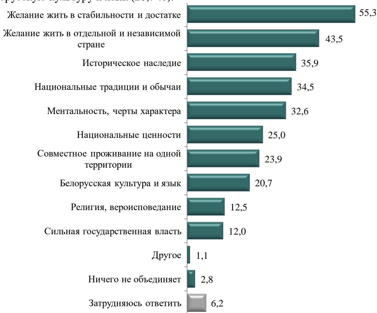
Рисунок 6 – Распределение ответов респондентов на вопрос: «Что, на ваш взгляд, прежде всего объединяет народ Беларуси?», %

Конструктивный патриотизм является одним из главных факторов социальной консолидации. По результатам исследования можно определить три базовых основания, объединяющих население Беларуси (см. рисунок 6). К их числу можно отнести, во-первых, потребность в социальном порядке, выраженную в желании жить в стабильности и достатке (55,3 %), а также в отдельной и независимой стране (43,5 %). Во-вторых, фактором общественной консолидации выступает система традиционных ценностей: историческое наследие (35,9 %), национальные традиции и обычаи (34,5 %) и ментальность (32,6 %). В-третьих, в качестве объединяющих условий респонденты отмечают культурно-территориальные аспекты – национальные ценности (25,0 %), совместное проживание (23,9 %) и белорусскую культуру и язык (20,7 %).