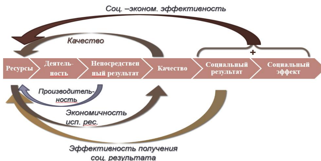
Рисунок 2 – Показатели эффективности социальных предприятий

Оценка эффективности перспективных социальных проектов, а также социально-экономической деятельности социальных предприятий в целом, может реализовываться на разных уровнях экономики страны. Как можно заметить на рисунке 2, показатели эффективности социальных предприятий, которые показывают, что на разных стадиях производства и реализации можно оценить различный показатель эффективности деятельности [2].