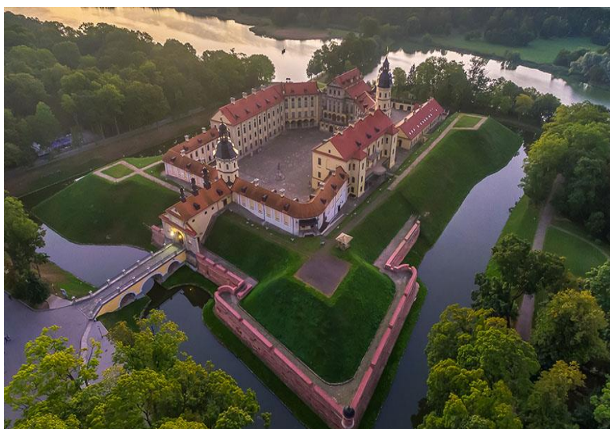
Рисунок 3 – Замок Радзивиллов в настоящее время

Первой мировой войны часть помещений Каменицы переоборудовали под военный госпиталь. На протяжении 1917–1920 гг. Несвиж пережил частую смену власти, но избежал разрушения и тотального ограбления. В 1939 г. замок стал государственной собственностью. В период немецкой оккупации во дворце действовал военный госпиталь. В мае 1945 года в замке начал работать санаторий и функционировал до 2001 года. В целях приспособления дворца для новых нужд была проведена частичная перепланировка помещений, проведено паровое отопление. В 1993 г. был образован музей-заповедник «Несвиж» [1], после чего вопрос о реставрации и консервации дворца приобрел особую актуальность. С 2001 г. проводились научно-исследовательские работы, разрабатывалась проектная документация. Масштабные реставрационные работы во дворцовом ансамбле начались в 2004 году. В 2008 году первый пусковой комплекс принимал посетителей. Второй пусковой комплекс, который включает основные площади дворцового ансамбля, открыт для посещения в июне 2012 года (рисунок 3).