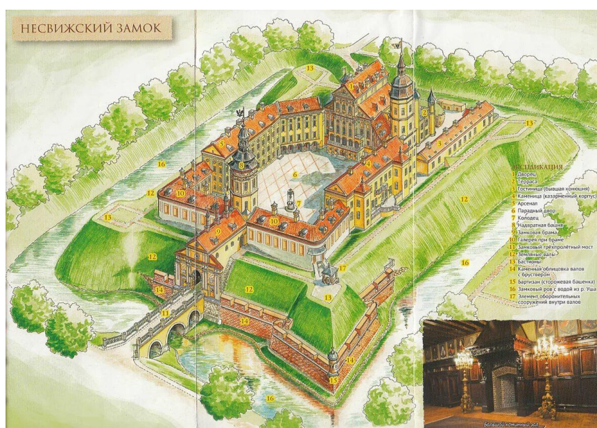
Рисунок 2 – Планировка замка Несвиж

Новый этап в истории дворца начался в 1730-е гг., когда Михаил Казимир Радзивилл Рыбонька (1702–1762) сделал Несвиж своей главной резиденцией. По его инициативе началась генеральная перестройка дворца, при этом оборонительная функция отступила на второй план, на первый вышла красота и пышность резиденции. Каменные бастионы были заменены земляными укреплениями (рисунок 2).