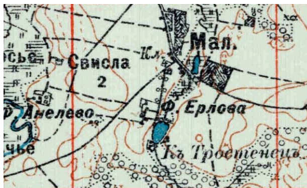
Рисунок 3 – Фольварок Ерлова на 2-х верстовой карте 1929 г. (вырезка)

Таким образом, строительная техника, материал и сопровождающие находки указывали на то, что перед нами остатки усадебного дома, возведенного в конце XVIII – начале XIX вв. Знакомство с письменными источниками и картографическим материалом позволило уточнить наше первоначальное предположение. Так, во второй половине XIX – начале XX вв. в окрестностях Малого Тростенца находились имения Тереховича, Сорочинского, Чекатовского, Юрловой, Попковского [2, с. 202; 3, с. 7; 4, с. 536]. Картографический материал, в частности карта Ф. Шуберта («трехверстка») конца XIX в. указывает на расположение в этом месте «господского дома» (обозначение « Госп.д. »), а топографические карты 1929 г. (рисунок 3) и 1933 г. фиксируют здесь «фольварок Ерлова» (Fw. Jerłowa /Ф.Ерлова) с застройкой. Данные факты уже позволяют уверенно связать данные фундаменты с остатками имения Юрловой. Совмещение данных карт с спутниковым снимком демонстрирует полное совпадение локализации фундамента «фольварка» и его обозначения на картах.