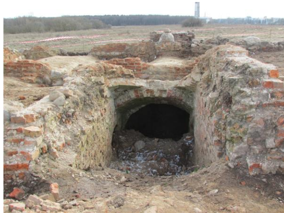
Фото 4 – Вид на вход в цокольный уровень усадебного дома на территории бывшего лагеря Малый Тростенец (вид с севера)