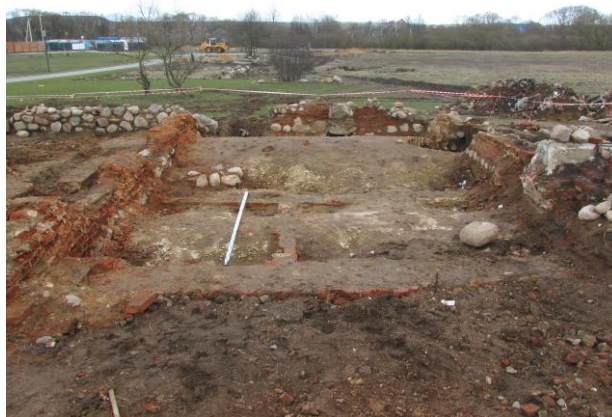
Фото 2 – Общий вид с запада на внутреннее пространство усадебного дома на территории бывшего лагеря Малый Тростенец