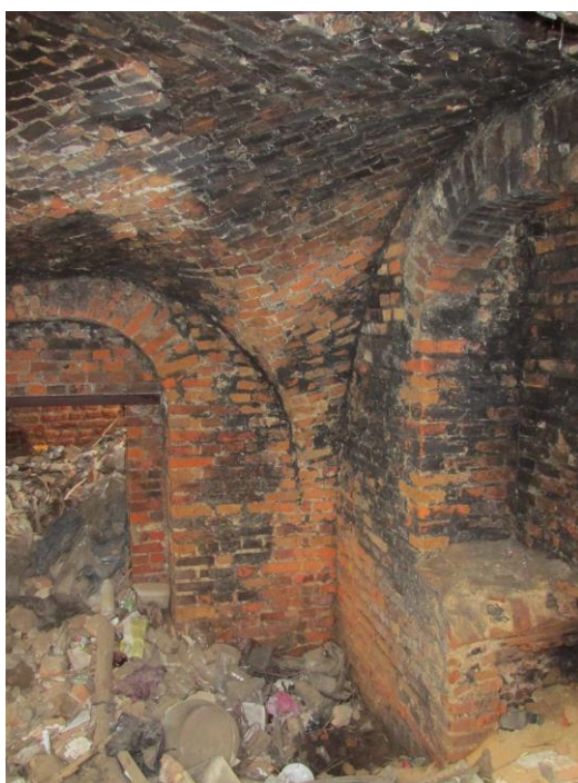
Фото 5 – Цокольная (подвальная) часть восточной части усадебного дома на территории бывшего лагеря Малый Тростенец

Промеры показали, что при сооружении фундаментов использован разный кирпич: