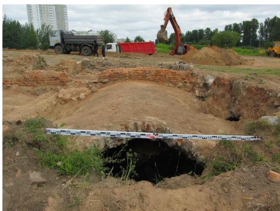
Фото 3 – Вид на арочное перекрытие восточной части усадебного дома на территории бывшего лагеря Малый Тростенец