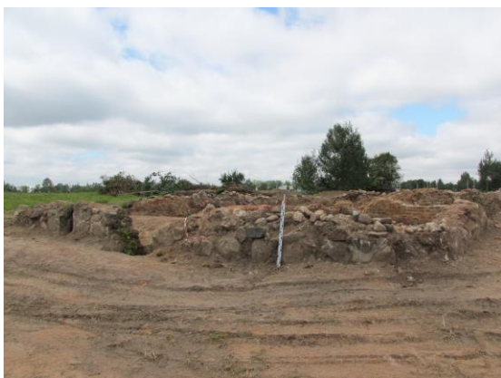
Фото 1 – Общий вид с востока на фундаменты усадебного дома на территории бывшего лагеря Малый Тростенец

Размеры фундаментов – 14,2 x 14,3 x 11,4 x 12,7 м (рисунок 2). Внешняя (видимая) часть фундамента сложена из камня, местами обработанного (колотого и гладкой стороной уложенного на внешнюю сторону фундамента). Однако в местах разрушения фундаментной стены при спуске в подвальное помещение просматривается, что в остальном фундамент сложен из красно-коричневого кирпича – пальчатки. Мощность (ширина) этого фундамента (в месте разрушения арочного свода) достигает 0,85 м. Судя по тому, что в данном объекте с восточной стороны имеются заглубленные подвалы с арочными перекрытиями, глубина заложения фундаментов здесь может составлять около 2,5 м (фото 1–5).