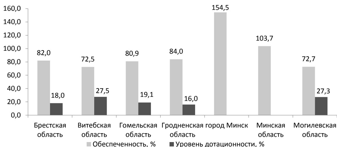
Рисунок 3 – Обеспеченность бюджета ФСЗН за 2021 год

Также следует обратить внимание на тот факт, что по итогам 2021 года почти все регионы Беларуси исполнили свои бюджеты ФСЗН с дефицитом и остаются дотационными (см. рисунок 3).