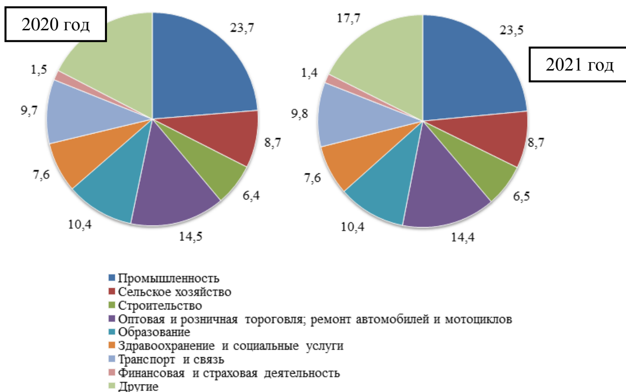
Рисунок 1 – Распределение численности занятого населения по отраслям экономики

На основании представленных данных на гистограммах проанализируем, какие отрасли пострадали от сокращения уровня занятости. Для промышленности 2021 г. был годом сокращения объемов производства по большинству видом промпроизводства. За год в промышленности численность рабочих сократилась на 0,2 %. В условиях пандемии большинство промышленных предприятий не могло работать дистанционно, что создало благоприятные условия для активного распространения пандемии. Также сокращение численности занятых наблюдается и в других отраслях экономики: оптовой и розничной торговле, ремонте автомобилей и мотоциклов и финансовой и страховой деятельности.