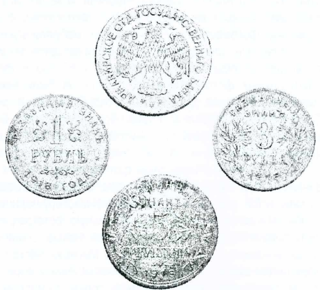
Малюнак 2