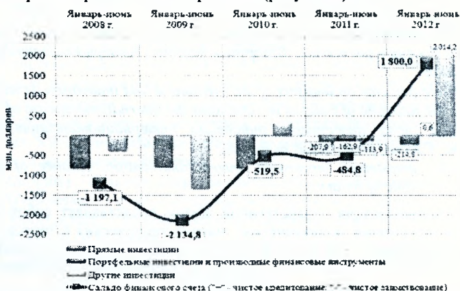
Рисунок 1 – Структура финансового счета платежного баланса Республики Беларусь с Российской Федерацией за январь-июнь 2008–2012 гг.

Согласно аналитическим данным, saldo финансового счета платежного баланса Республики Беларусь с Российской Федерацией сформировалось положительным в размере 1,8 млрд. долларов (за январь – июнь 2011 г. – отрицательное saldo в размере 0,5 млрд. долларов). Это означает, что в первом полугодии 2012 г. экономика Республики Беларусь явилась «чистым кредитором» резидентов Российской Федерации. Главным образом за счет увеличения чистых иностранных активов центрального банка (с учетом погашения внешних обязательств) в форме депозитов, накопления дебиторской задолженности по внешнеторговым операциям и сокращения внешних обязательств депозитных организаций по ранее привлеченным кредитам (рисунок 1).