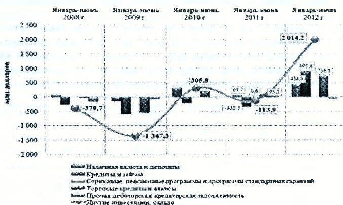
Рисунок 3 – Сальдо операций с другими инвестициями в разрезе финансовых инструментов за январь–июнь 2008–2012 гг.

Другие инвестиции по финансовым инструментам представлены на рисунке 3.