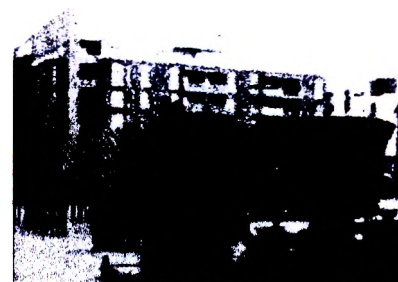
Рисунок 5 – Двор с садом Отражений, Хельсинки, Арабианранта.