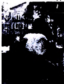
Рисунок 1 – Скульптура, г. Минск, ул. Стахановская, внутренний двор между домами №31 и 35.

нения в образе жизни современного человека (рис. 4, 5). Обеспечение комфортности среды для человека не может идти без рассмотрения аспекта видеозекологии, акцентирующей необходимость гармоничного взаимодействия архитектурных объектов с открытыми пространствами вокруг них.