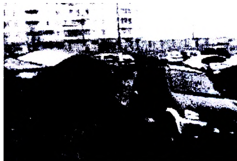
Рисунок 2 – Стоянка транспортных средств в «зеленой зоне» (дворовая территория).