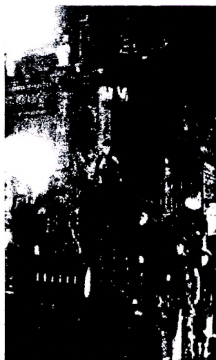
Рисунок 2 – Интерьер главной синагоги

По законам Российской империи синагоги, по существовавшему тогда строительному кодексу, разрешали строить на каждые 80 домов. В Польском Бресте-над-Бугом насчитывалось около 40 синагог и молитвенных домов. Бывшие синагоги в Бресте размещались на улицах: Дзержинского, 25 (в здании спортивной школы), Советских Пограничников, 52 (здание клуба «Прогресс»), а также на улицах Ленина, Пушкинской. Кирова и Горького.