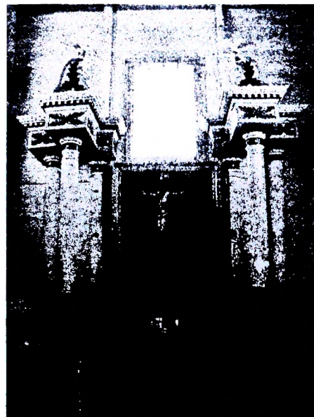
Рисунок 5 – Боковой алтарь «Распятие»

В настоящее время актуален вопрос сохранения храма св. Николая в д. Кожан-Городок и его интерьера. Ведь только благодаря активной жизненной позиции жителей деревни и толерантности священника были сохранены униатские алтари в середине XIX в. и в настоящее время. Храм нуждается в ремонте, основной сруб наклонился еще с советских времен. Шедевром деревянного зодчества является Свято-Николаевская церковь и накануне своего 200-летия лучшим подарком для нее и для всех жителей города была бы ее реконструкция. Памятников деревянного народного зодчества такого уровня на территории Беларуси сохранилось мало, тем не менее, найти средства на ремонт, реставрацию старинных икон, комплексное обследование сооружения не удастся. Такая же ситуация происходит и с униатской деревянной Георгиевской церковью в д. Синкевичи, расположенной неподалеку и которая насчитывает около 300 лет своего существования.