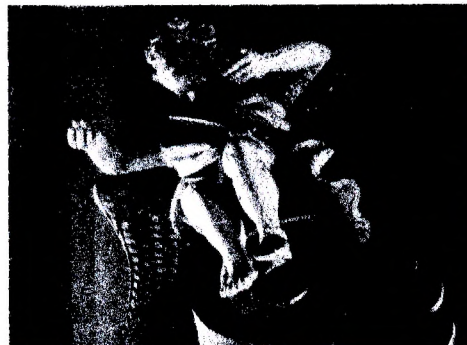
Рисунок 4 – Скульптура ангела на боковом алтаре

Второй ярус является выразительным завершением всего главного алтаря, состоящим из скульптурных и архитектурных элементов – это полукруглая ниша с установленной в ней картиной-иконой и фланкированной с двух сторон небольшими колоннами. Капители колонн верхнего яруса непосредствен-