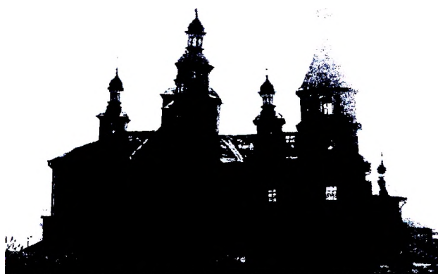
Рисунок 1 – Вид на Свято-Николаевскую церковь

стяжками: нижний расположен по периметру стен, верхний – крест-накрест. Центральный сруб поддерживается четырьмя столбами круглого сечения. Переходы между ярусами срубов сделаны с помощью парусов. В интерьере доминирует верхний свет, проникающий через окна в сводах «коробового» типа, композиционно связывая между собой центральное помещение с остальными.