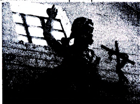
Рисунок 2 – Скульптура Иоанна Крестителя

Главный алтарь в настоящее время закрыт иконостасом, установленным в 1830-е гг. и обзор его, к сожалению ограничен. Композиция алтаря является двухъярусной. Первый ярус представляет собой сильно выступающий вперед портик, опирающийся на вынесенные за плоскость стены колонны круглого сечения. Форма портика имеет ломанный прямоугольный силуэт, выступающие части которого и поддерживают эти колонны, установленные на постамент. Ритм ордерному построению задают две пары полуколонн, одна из пар которых имеет граненую форму. У оснований полуколонн на постаментах расположены большие скульптуры св. апостолов Петра и Павла. Большая картина униатского письма занимает все пространство между колоннами и венчает собой резную деревянную нишу, где расположена икона меньшего размера.